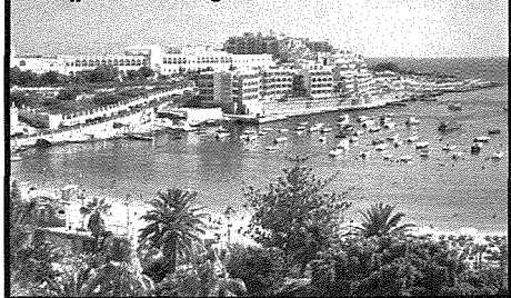
Il-Bajja ta' San Ġorġ

Il-lokalità ta' San Ġiljan hija wahda minn dawk il-lokalitajiet f'Malta li jinsabu vicin hafna tal-baħar. Fil-bidu dan kien biss raħal ċkejken tas-sajjeda li kien magħqud mal-limiti ta' Birkirkara. Sa qabel il-wasla tal-Kavallieri ta' San Ġwann postijiet bħal dawn ma setghux jiżviluppaw sewwa għax in-nies kienet tibża' tghammar daqshekk vicin il-baħar. Dan kien dovut għal fatt li dawn il-postijiet kienu ta' sikwit jiġu attakkati mill-furbani tal-baħar li kienu jisirqu kull ma jiġi għal idejhom u jkaxkru lil min jaqbd u fil-ġasar. Wara l-1530 il-Kavallieri bdew jaħsbu biex jiffortifikaw il-kosta Maltija biex inaqqsu l-ħbit tal-kursara. Naturalment l-ewwel inhawi li ġew fortifikati kienu l-inhawi tal-Port il-Kbir. Wara bdiet tinghata attenzjoni lil dahliet ohra li kienu kennija biżżejjed li fihom seta' jsir żbark tal-għadu. Kien il-Gran Mastru Alof deWignacourt li haseb biex jiddefendi bis-serjeta' il-kosta ta' Malta. Dan il-Gran Mastru haseb biex minn butu jibni numru ta' torrijiet f'postijiet vulnerabbli għall-attakki mill-baħar. Dawn kienu l-inhawi ta' Marsaxlokk, Wied il-Għajn, San Pawl il-Baħar, ix-Xgħajra ta' Haż-Żabbar u Kemmuna. Il-Gran Mastru Lascaris haseb ukoll biex ikompli jsaħħaħ id-difiża tal-kosta. Huwa bena t-torrijiet ta' Sant' Agata fil-Mellieħa, iehor fil-Ġnejna u iehor f'Għajn Tuffieħa, wieħed f'Wied iż-Żurrieq u wieħed l-Qawra, bena iehor fin-Nadur limiti tar-Rabat ta' Malta u iehor fil-Bajja ta' San Ġorġ f'San Ġiljan. Dan it-