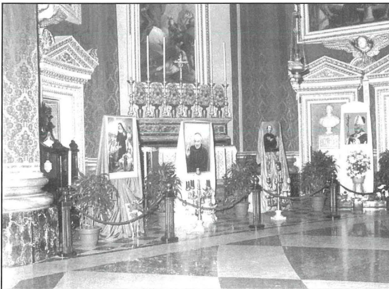
Tifkira tal-Beatifikazzjoni ta' Sr. Adeodata Pisani, Dun Ġorġ Preca u l-Kjeriku Nazju Falzon fil-Knisja Arċipretali tal-Mosta fl-okkażjoni tal-Papa Ġwanni Pawlu II f'Malta f'Mejju 2001.

Il-poplu prezenti fi Pjazza San Publiju ferah u ċapċap bil-qalb hekk kif il-Q.T. il-Papa dikkjara lit-tliet qaddejja t'Alla, bhala Beati, u l-kwadri bix-xbihat taghhom inkixfu. Kien mument ta' glorja lil Alla f'dawn il-qaddejja Tieghu li tul hajjithom ghexu l-virtujiet Teologali tal-fidi, tama u imhabba, fil-perfezzjoni taghhom, b'mod erojku. Kien mument ta' glorja ghall-Knisja f'Malta li tul 2000 sena ta' Kristjaneżmu, dejjem maghquda ma' Ruma, kien ghad ma kellhiex Beatu jew Qaddis kanonizzat taghha. Kien mument ta' glorja wkoll ghal min hadem b'dedikazzjoni kbira biex tul ammont ta' snin, wassal lil dawn it-tliet kandidati ghall-Beatifikazzjoni.