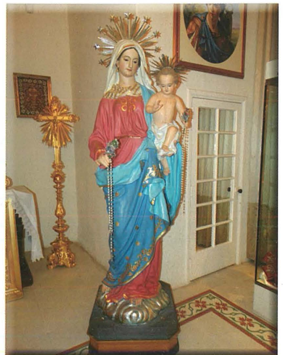
il-Madonna tar-Rużarju (San Ġiljan)

Id-difna saret fit-8 ta' filgħodu ta' nhar is-27 ta' Novembru. Hu kien it-80,249 li ġie midfun fiċ-ċimiterju tal-Adolorata. Hija tassew sfortuna li m'hemm l-ebda tifkira fuq qabru. Ġewwa Malta nsibu xi postijiet li hemm toroq imsemmija għalih fosthom ġewwa Ħal Lija, il-Mosta, il-Ħamrun, il-Qrendi u Ħal Kirkop.