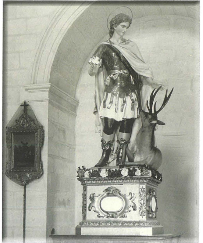
L-istatwa fuq il-pedestall l-antik

il-fratellanza. Il-qabar qiegħed Div. Punente, Sezzjoni K, Kimpartimento A.