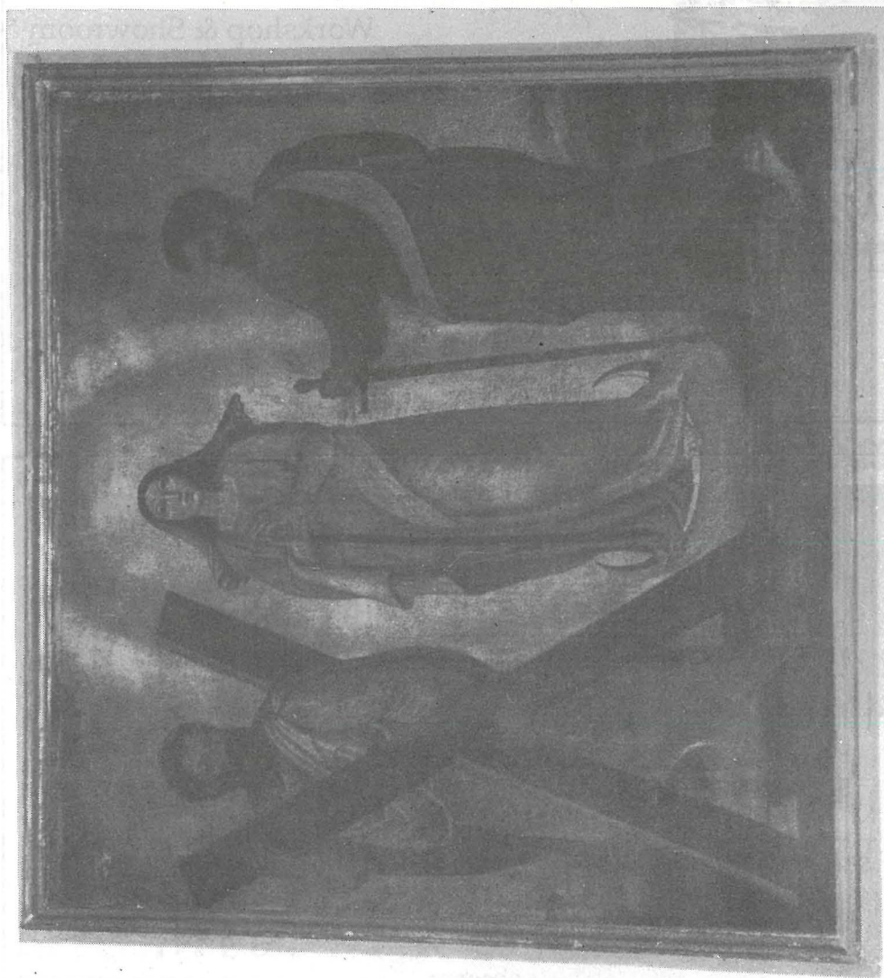
It-Titular l-antik ta' Sant'Andrija mpitter minn Filippu Dingli