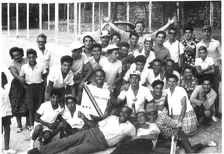
Waħda mix-xalati ta' wara l-festa.

Aħna t-tfal konna nirsistu u naħsbu sew minn