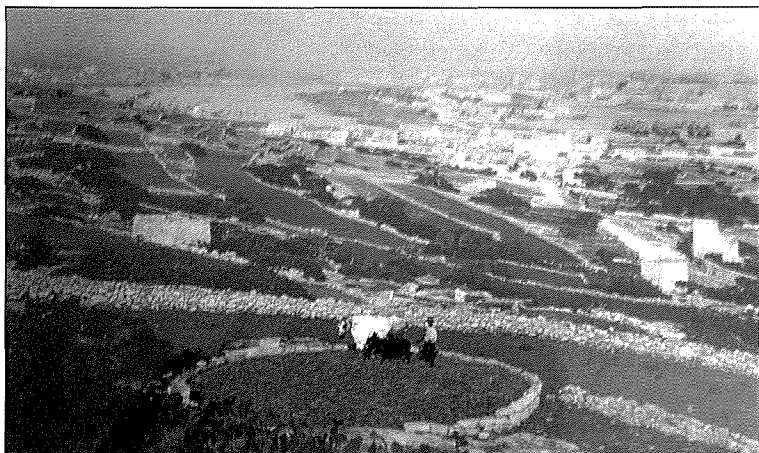
Dehra tal-Kappara thares lejn Marsamxett.