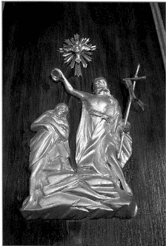
Il-battisteru tal-Knisja Parrokkjali ta' San Ġiljan, li sar b'donazzjoni ta' Dun Ġużepp Xerri (dak iż-żmien Viċi Parroku).

jumejn wara din id-data, kien li l-Knisja ta' San Ġiljan saret viċi parroċċa u sagramentali, iżda milli jidher apparti t-tqarbin, is-sagramenti ma kinux isiru fiha. Papagiorcopulo jgħid li din l-informazzjoni tingħata fil-ktieb ta' Benjamin Vella, Storja ta' Birkirkara u l-kolleġġjata tagħha , miktub fl-1934.