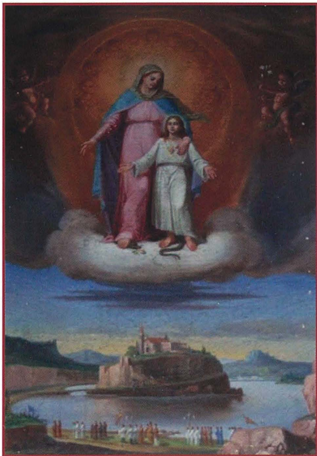
Il-kwadru tas-Sacro Cuor, li ukoll iġib il-firma ta' Cefail. Illum jinsab fis-sagristija tal-Knisja ta' Lapsi.

Sorsi oħra 3 jsemmu xi xogħlijiet tiegħu f'Hal Qormi u f'Wied il-Għajn, minbarra dawk ta' San Ġiljan. Dakta' Wied il-Għajn jinsab fis-sagristija tal-knisja parrokkjali u t-tema tiegħu hija Konverżazzjoni Qaddisa . Kwadru sabiħ li jipprezentalna l-figura tal-Madonna bil-Bambin fin-nofs tal-inkwadru, b'San Ġużepp fuq naħa jidher iħares lejhom u b'Sant'Elizabetta żzomm liċ-ċkejken Ġwanni l-Għammied. Fuqhom ilkoll ġmiel ta' kompożizzjoni angelika żzejjen dan il-kwadru. Meta wieħed jara dan il-kwadru jifhem aktar x'ried ifisser Buhagiar fil-