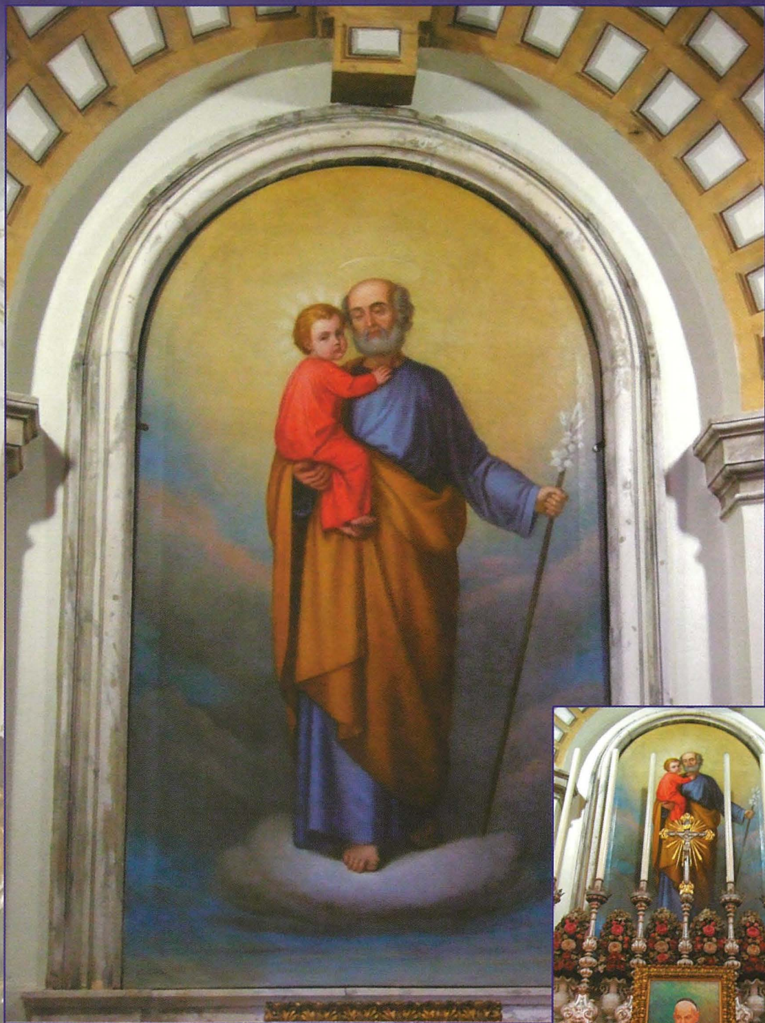
Il-kwadru restawrat (fuq) u l-altar ta' San Ġużepp armat għall-festa (lemin).