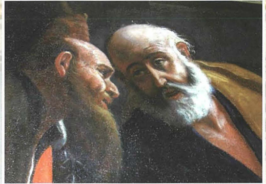
Dettall mill-kwadru San Pietru u San Pawl Sejrin għall-Martirju