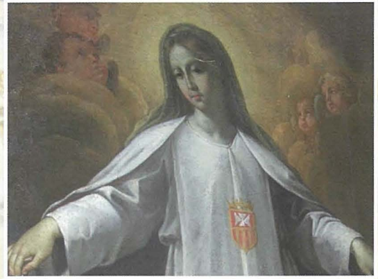
Dettall mill-kwadru Il-Madonna tal-Ħniena

Staqsejtu x'juża' għal dan il-proċess u hu semmieli 'fost affarijiet oħra hemm it-termokawterjo – li tkun bħal kuċċarina ċatta li tishon bl-elettriku. Din tniżżel il-kulur minfuħ u terġa' twaħħdu mat-tala oriġinali, li issa tkun ukoll imsaħħa bit-tala l-ġdida. Il-kulur jibqa' dak oriġinali. Inti kull ma tkun għamilt hu li ssaħħu bil-kimika li tagħtih.' Ergajt staqsejtu jekk f'dan il-proċess ikunx hemm bżonn li jiżdied il-kulur fuq dak oriġinali. Hawnhekk qalli, 'Ġieli jkun hemm bżonn ta' rtukkjar u dan isir biss fejn il-kulur ikun intilef għal kollox. Biss ir-restawratur jieħu ħsieb li dan ir-re-touching ikun proċess riversibbli, jiġifieri jgħaddi kemm jgħaddi żmien, restawratur ieħor ikun jista' jneħħi dan il-kulur miżjud.'