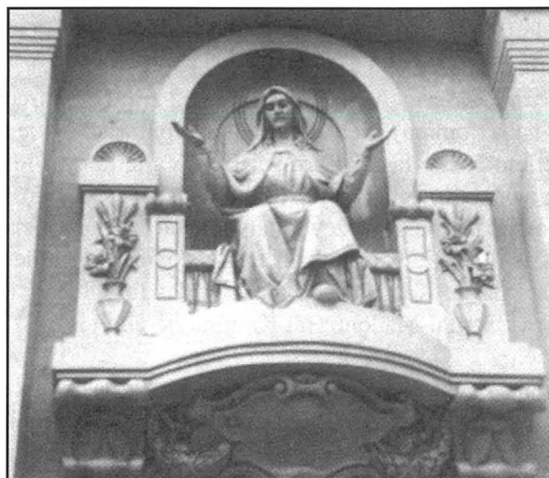
Statwa tal-Madonna fuq il-faċċata tal-kappella tal-MUSEUM fil-Blata l-Bajda – xogħol Marco Montebello fl-1962.

Minn barra dawn l-istatwi kollha, l-iskultur Montebello hadem ukoll numru kbir ta' statwi ohra li jinsabu f'diversi niċċ fit-toroq Maltin, kif ukoll għadd ta' monumenti funebri kemm fil-ġebel kif ukoll fl-irham f'diversi ċimiterji, b'mod speċjali f'dak ta' l-Addolorata.