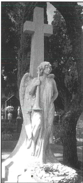
Wieħed mill-monumenti funebri li jinsab fiċ-Ċimiterju ta' l-Addolorata, xogħol ta' Marco Montebello.

Għal fuq il-kampnar tal-knisja tal-Patrijiet Franġiskani tal-Hamrun, hadem statwa kbira ta' San Franġisk t'Assisi. F'Haż-Żabbar hadem l-istatwa tal-Papa Alessandru VII, li qabel sar Papa kien inkwizitur f'Malta u kellu devozzjoni lejn is-Santwarju ta' Haż-Żabbar.