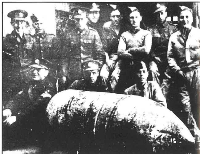
Il-grupp tal-bomb disposal unit tal-bomba Germaniża wara li ddifjużjawha. Ir-ritratt jenfasizza l-kobor tal-bomba li niffdet il-koppla tar-Rotunda.