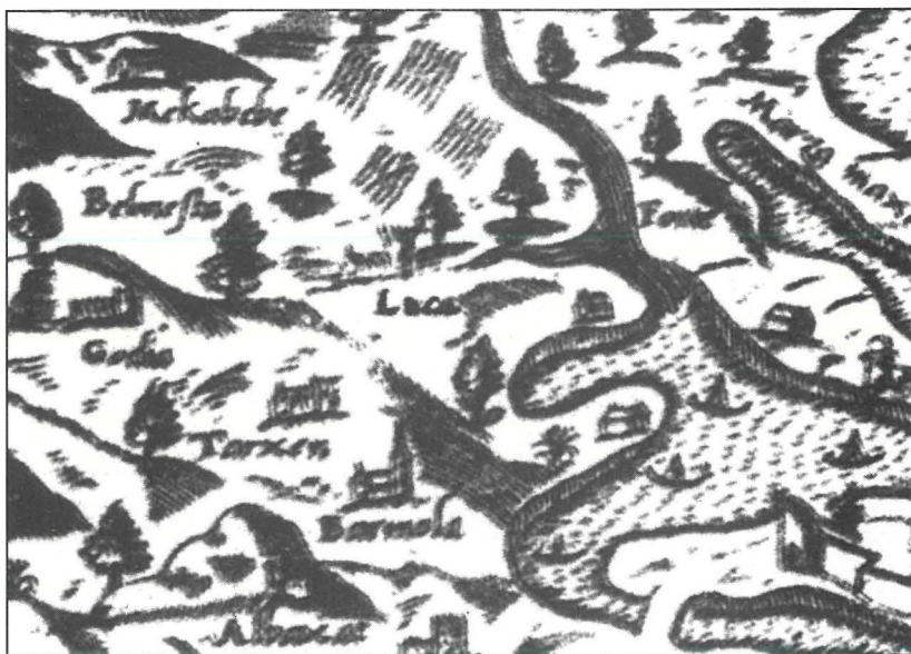
Hal Luqa kif tidher fil-mappa ta’ Camocio (?) (1558-62)

Il-pittur Taljan Matteo Perez D’Aleccio (1546-1616) wasal Malta minn Napli f’it wara l-1576 wara li kien ħarab minn Ruma minhabba xi nkwiet. Il-Granmastru La Cassiere laqgħu tajjeb u bis-sahha tal-patroċinju tiegħu Perez D’Aleccio kiseb hafna kummissjonijiet importanti, kemm għall-Ordni kif ukoll għall-Knisja. Huwa kien