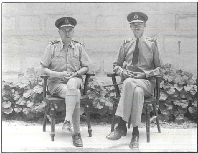
Air Vice-Marshal H.P. Lloyd u Air Vice-Marshal K. Park

L-ajrudrom il-ġdid inawgurah il-Gvernatur Gort nhar is-Sibt 15 ta' Mejju 1943, xahrejn u nofs biss wara li beda x-xogħol fuqu. Air Vice-Marshal Keith Park, Kmandant tal-Forzi tal-Ajru f'Malta, żanzan l-ajrudrom billi għamel titjira fuq l-ajruplan personali tiegħu, Supermarine Spitfire Mk V .