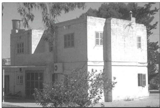
Id-dar tal-OC RAF Safi

Hal Safi gawda wkoll minn numru ta' mwejjed u sigġijiet, u ammont konsiderevoli ta' cable u materjal iehor biex fil-festa r-rahall jiddawwal bl-aħjar mod possibbli. Biswit id-dar tal-OC kien hemm għalqa fejn it-tfal Halsafin kellhom il-permess imorru jilagħbu u jagħmlu użu mill-bandli ta' ġo fiha. Iktar 'il quddiem, dan il-post ta' rikreazzjoni waqa' f'idejn il-Forzi Armati ta' Malta u nbidel f'shooting range.