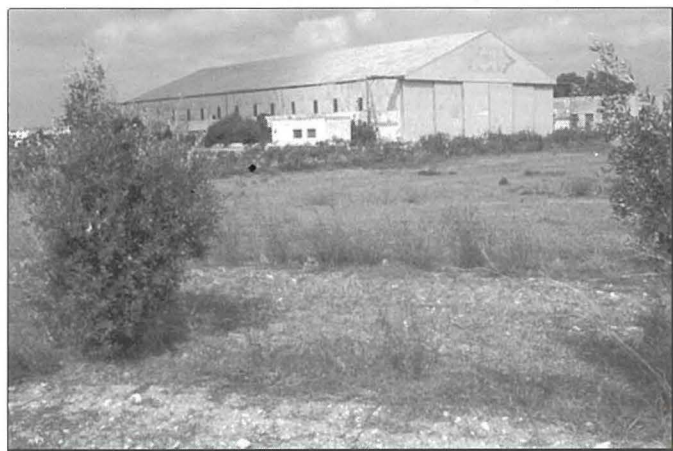
Il-hangar tal-NCA

Fl-2010, il-hangar tal-NCA inhatt u minflokha tela' iehor ġdid. Hekk issa, apparti Medavia, kien hemm kumpanija oħra, SR Technics, li bdiet topera fil-Karwija, bit-tnejn li huma joffru servizzi ta' MRO (Maintenance, Repair u Overhaul).