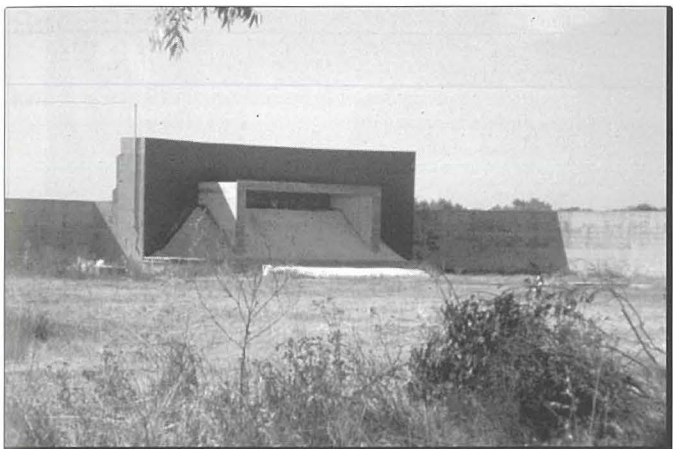
lx-shooting range tal-Karwija

Tabilhaqq illi l-Karwija, f'dawn l-ahhar 70 sena, ghaddiet minn ġrajja verament imżewġa. Rat il-kruha tal-gwerra, is-sbuhija tal-paċi, kif ukoll il-benefiċċji li jġib mieghu il-progress.