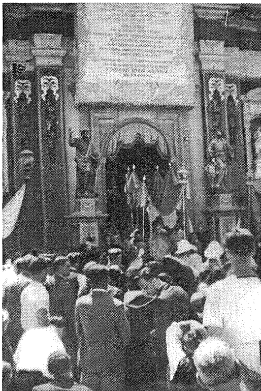
L-armar tal-faccata tal-knisja iservi ta' sfond għall-purċissjoni ta' Corpus Domini