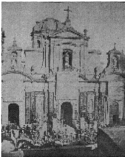
Il-faccata tal-Knisja armata għall-festa ta' Corpus Domini fit-tieni nofs tas-seklu 19.

Fuq l-arkaturi ta' fuq il-fruntuni tal-bibien, bħal ma għadu jsir sal-llum, kienu jintramaw tlett kelmiet. Dak iż-żmien pero kienu jintramaw kliem differenti f'kull festa. Insibu għalhekk li fil-festa ta' Corpus Domini kienu jintramaw il-kliem 'VOBIS MEIPSUM