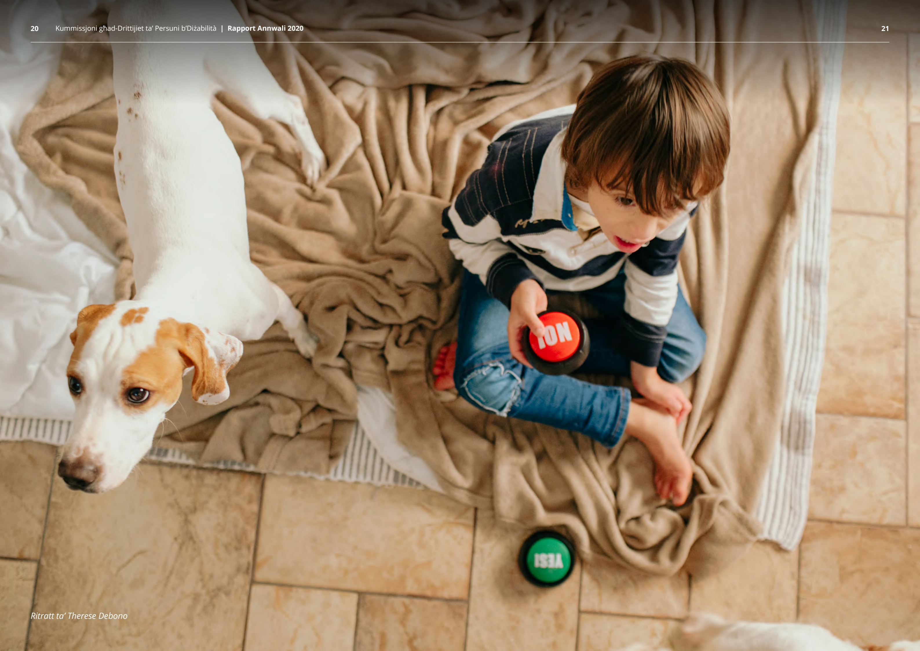
Ritratt ta' Therese Debono