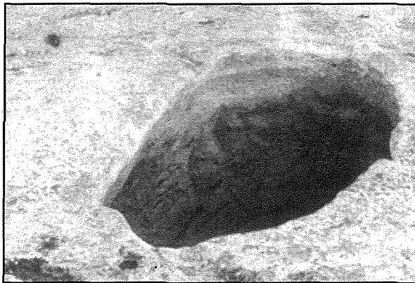
Il-Misqa – wiehed mill-bjar ovali mhux imsaqqaf.