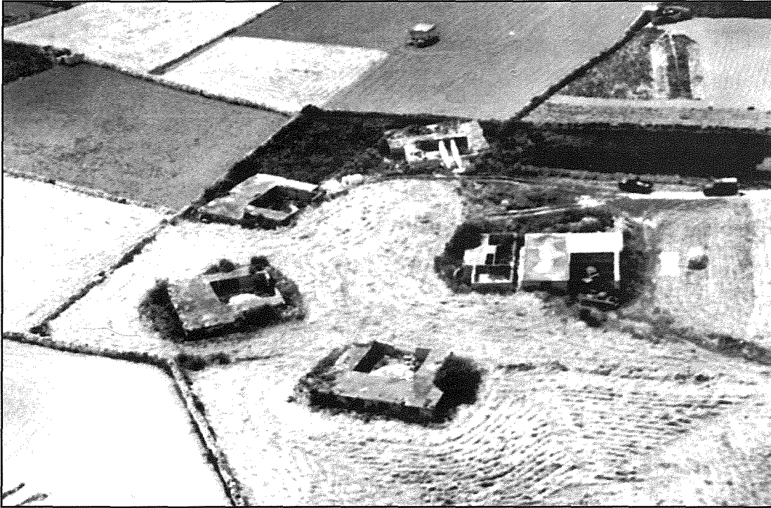
Debra mill-ajru tal-Fortizza li kellha erba' kanuni tat-tip BOFORS 3.7 INCH. Jidber ukoll il-post fejn kien hemm il-COMMAND POST.