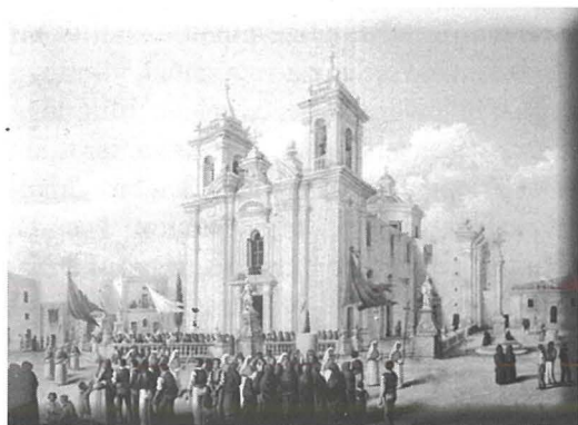
Il-Knisja ta' al Luqa. Pittura ta' Raphael Caruana Dingli

Dettalji dwar il-mod kif Michelangelo Sapiano ħadem u stalla dan l-arloġġ fl-1881 huma skarsi ferm u biex inkunu għidna kollhox ma tistax toqgħod fuqhom.