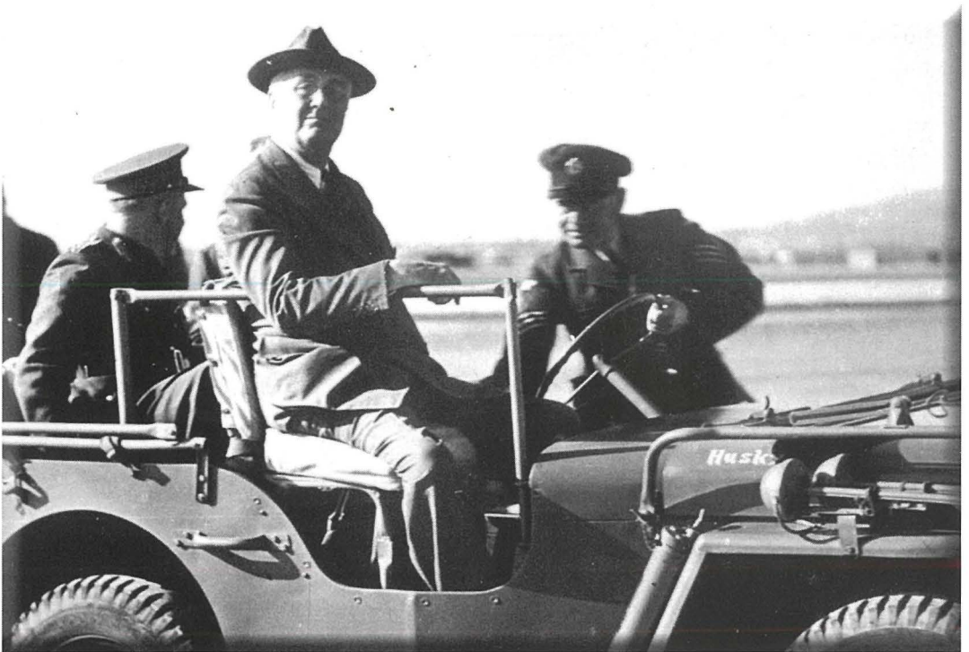
Il- Willis Jeep kienet modifikata apposta biex tkun tista' tintuża mill-President Roosevelt, speċjalment dak il-poġġaman biex ikun jista' jzomm miegħu. Ta' min jinnota l-isem 'Husky' fuq il-bonnet tal- Jeep . Din il- Jeep illum tinsab fil-Mużew tal-Gwerra, Sant'Iermu, l-Belt Valletta