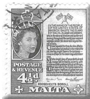
Il-bolla li għet ippubblikata fl-1956 mill-Posta Ġenerali ta' Malta li turi ċ-Ċittazzjoni tal-President Amerikan F.D. Roosevelt, bil-valur ta' erba' soldi u nofs