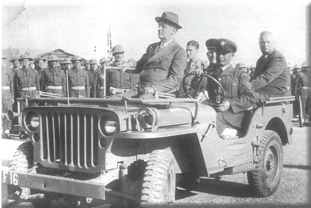
Il-President jispjezzjona Gwardja tal-Unur iffurmata minn suldati Maltin. Bilqeghda ezatt warajh hemm il-Gvernatur ta' Malta Lord Gort