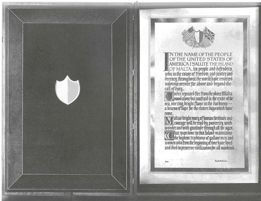
Eżatt wara l-ispezzjoni tal-gwardja tal-unur il-President Amerikan għamel diskors qasir li fih qara ċ-Ċittazzjoni ta' Ġieħ li mbagħad ippreżenta lill-Poplu Malti. Dan ir-ritratt juri din il-parċmina ddekorata bil-gwarniċ tal-injam tal-ġewż fuq ix-xellug u l-għatu bl-Arma ta' Malta fuq il-lemin li jservi ta' għatu

unika.” 11 Din għadha hemm sal-lum u tista' tgħid li kuljum tara turisti jgħidulha r-ritratti, flimkien maż-żewġ irħamiet l-oħra li jfakkru l-Indipendenza ta' Malta fl-1964 u r-Repubblika ta' Malta fl-1974.