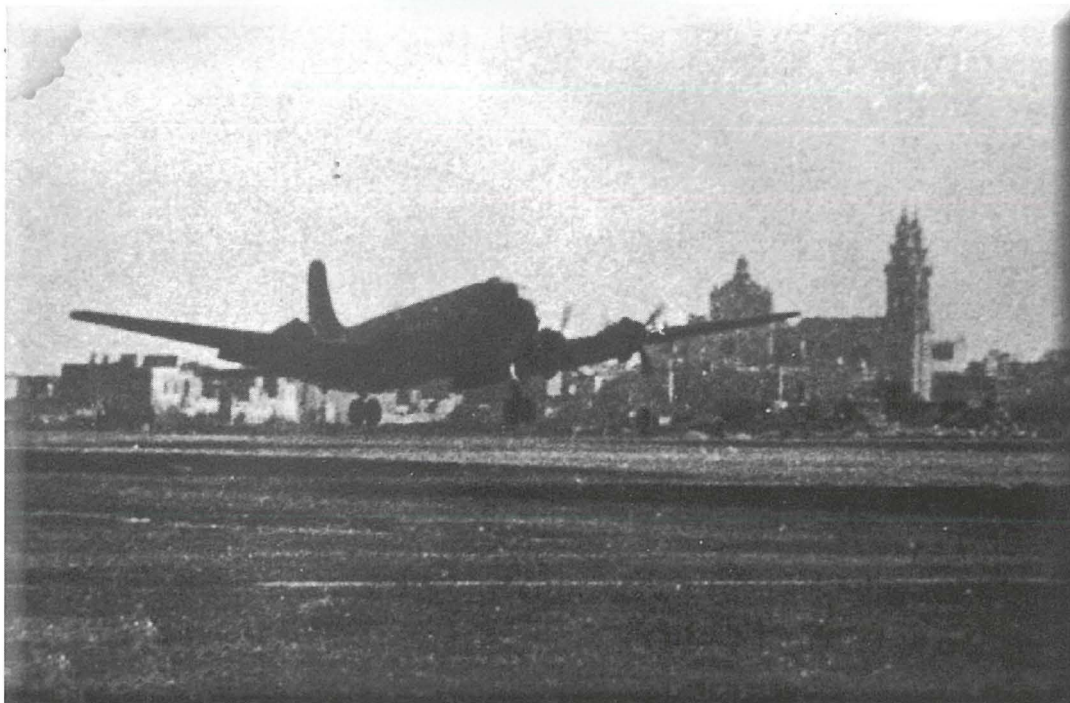
Il-wasla tal-President Franklin D. Roosevelt, fl-isfont tidher il-Knisja ta' Hal Luqa

l-Arċisqof li kien indispost - lill-President Amerikan, Roosevelt qara diskors biex jagħti ġieħ lil Malta u lill-Maltin tal-qlubija tagħhom fil-ġlieda għall-libertà. 5 Ta' min jiriproduċi d-diskors kollu fil-forma originali biex ikun jista' jiġi apprezzat aħjar: