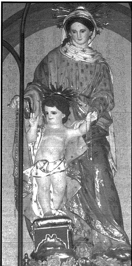
Carmelo Mallia Il-Madonna tar- Rużarju Knisja Parrokkjali ta' Santa Marija, Qrendi

L-istejjer marbutin mal-vari tal-Madonna tar-Rużarju fil-Qrendi, speċjalment ta' dik ikkummissjonata minn Magri, huma xhieda ta' kemm xoghlijiet ta' l-arti mhux biss jaqdu l-htigijiet devozzjonali tal-fidili, iżda jistgħu wkoll ikunu xhieda