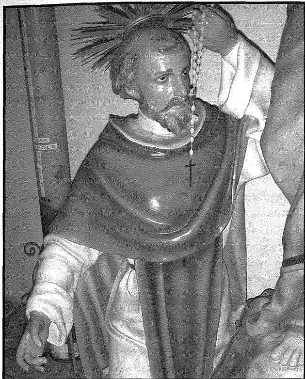
Dettall tal-figura ta' San Duminku

fil-figuri ta' San Luqa (xoghol Carmelo Mallia stess ta' c. 1912) u tal- Papa Urbanu IV (statwa ta' Carlo Darmanin) li jintramaw fir-Rabat fl-okkażjoni tal-festa ta' San Pawl. 36