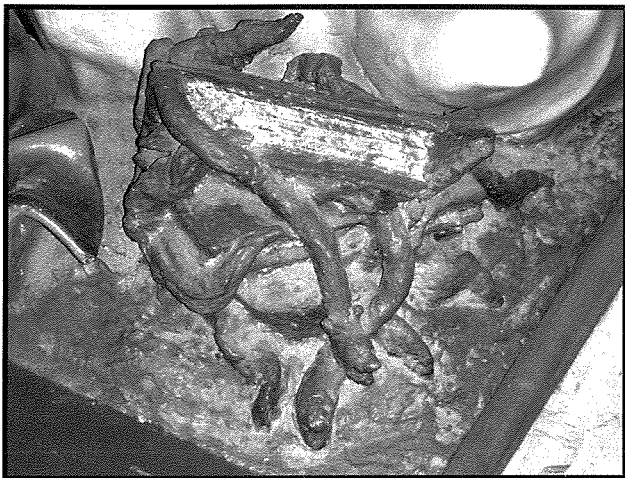
Il-kotba jinharqu u s-sriep herġin minnhom: dettall mill-vara tal-Madonna tar-Rużarju.

ma jinqalghux kumplikazzjonijiet parrokkjali, il-kleru tal-Qrendi għalhekk iddeċieda li jerga' jdur għall-istatwa tar-Rużarju ta' l-1920. 46 Minn dak iż-żmien 'l hawn, din il-vara baqgħet tintuża waqt il-festa tal-Madonna tar-Rużarju f'dan ir-rahall filwaqt li matul is-sena tkun miżmuma f'niċċa fis-sagristerija tal-knisja parrokkjali.