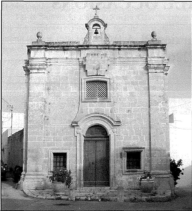
Il-knisja magħrufa ta' Santa Veneranda. Illum insibuha knisja ta' Sant'Anna.

Fil-kitba dwar din il-viżta l-ewwel żar il-knejjes li kienu fir-rahall tal-Qrendi. Huwa beda biex żar il-knisja tal-Madonna tal-Hniena li dwarha jaghtina