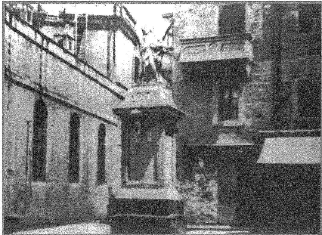
Statwa ta' Sant' Andrija tal-ġebel li kienet quddiem ix-xatt fi Pjazza Gavino Gulia.