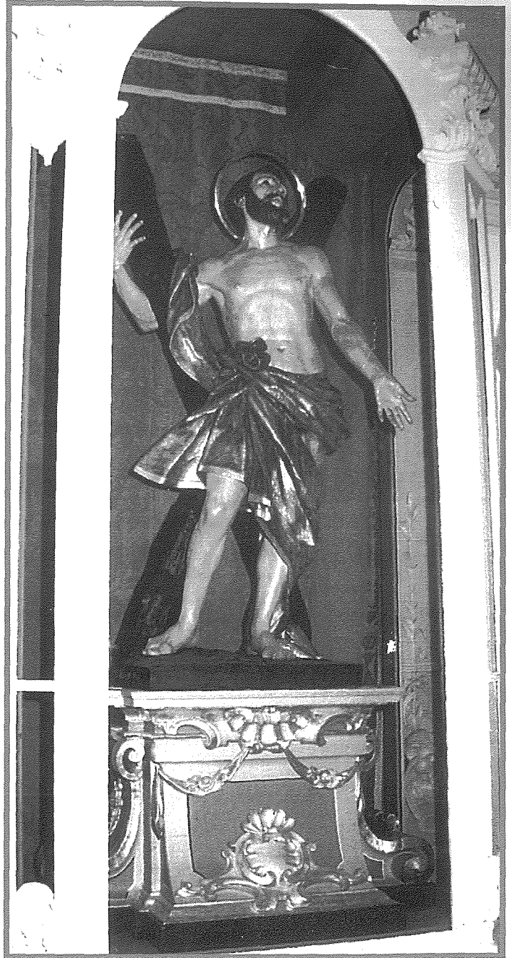
L-istatwa ta' Sant' Andrija li tinsab f'niċċa ġewwa s-sagristija, xogħol l-iskultur Salvatore Psaila fis-sena 1844.

Statwa oħra ta' dan il-qaddis kienet twaqqfet fil-wesa' tax-xatt, fejn illum hemm is-sede tal-Banda San Ġorġ ta' Bormla fi Pjazza Gavino Gulia. Din kienet tal-ġebel wieqfa fuq pedestall għoli u kellha xebħ kbir ma' dik li kien għamel l-iskultur Salvatore Psaila għall-knisja. Sfortunatament din l-istatwa ntilfet meta ntaqtet bil-bombi tal-ġhadu waqt it-Tieni Gwerra Dinjija.