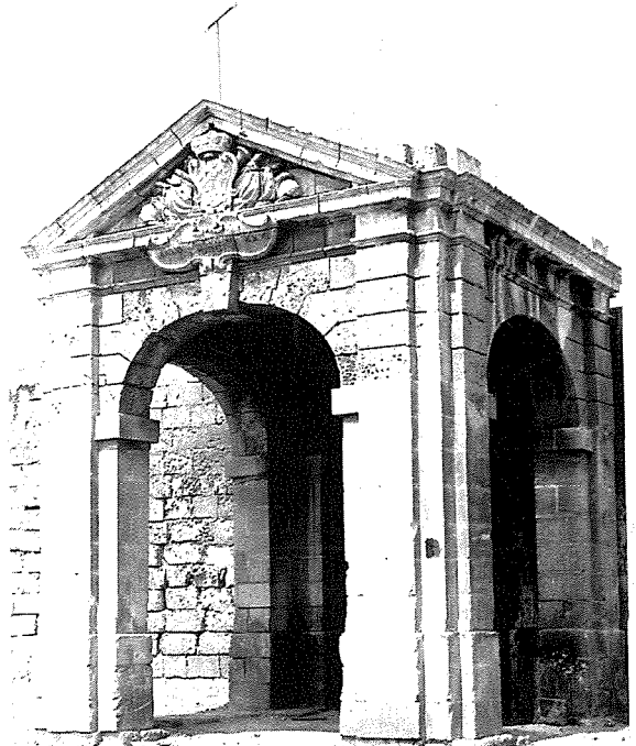
It-Tribuna ta' Pinto kif kienet qabel ma giet restawrata fl-1981. Warajha jidher, ħajt li kien jagħmel parti minn kumpless agrikolu tas-seklu 18.

Iżda jekk ma nafux x'kienet din it-Tribuna nistgħu, min-naha l-oħra, nghidu x'ma kinitx għax, nghiduha kif inhi, inkitbu u ntqalu bosta hmerijiet dwarha. Kien hemm min qal li Pinto kien jiġi hawnhekk biex jara t-