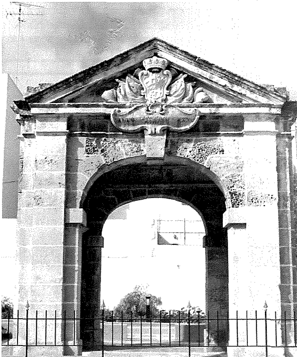
It-Tribuna ta' Pinto kif tidher illum, wara restawr u riabilitazzjoni tal-lokal li sar fl-2000.

tigrijiet tal-bhejjem, haġa li ma setgħetx tkun għax kull ma kien hawn quddiemha kienet parti mill-pjanura tal-Marsa li hafna minnha kienet għadha bassasa, jew marshland bl-Ingliż. Dan apparti l-fatt li ma kienet teżisti ebda korsa taż-żwiemel fil-gżira. Niftakar ukoll li, snin ilu, wiehed kien qal fuq programm popolari tar-radio li din it-tribuna kienet timmarka l-bidu tal-artijiet ta' Stagno. Iżda din il-persuna insiet li l-Palazz ta' Stagno qiegħed wara l-Knisja ta' San Ġorġ, distanza kbira hafna mit-tribuna u li bejnha u l-palazz kien ilu jeżisti l-bini għal mijiet tas-snin. Ukoll ġie li smajt li nbni biex taħtha jingabru l-qbiela tal-bdiewa, haġa improbabbli biex ma nghidux haġ'ohra. Min ser joqgħod jibni tribuna dekorattiva bħal din biex sempliċement jiġbor il-qbiela taħtha?