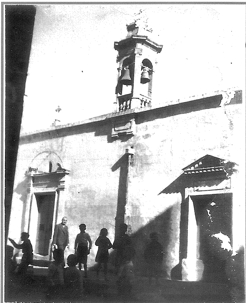
O.L. Of Assumption & Victories Church. Tal Ftajjar. Luqa Malta.

Nghid hekk għax, kien għall-ħabta ta’ dan iż-żmien li kien qiegħed isir ħafna bini ta’ kappelli bħalha. Il-post kien fl-istess post fejn illum hemm il-knisja parrokkjali. Din it-tip ta’ kappella kellha l-arkitettura tagħha x’aktarx bħal ta’ ħafna oħrajn f’Malta. Forsi kienet tixbaħ lill-kappella ta’ Santa Marija tal-Ftajjar f’Hal Luqa stess. Din kienet tkun