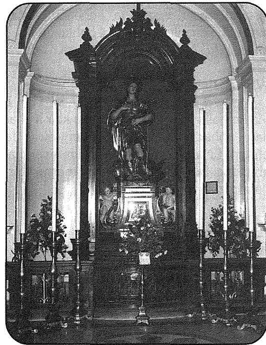
In-Niċċa ta' San Ġorġ bil-Vara Titulari

Bdejna din il-kitba bili għidna li l-festa ta' San Ġorġ għandha tfakkarna f'Manwel Buhagiar u dan intennuh bir-ragun kollu. Nibdew min-niċċa