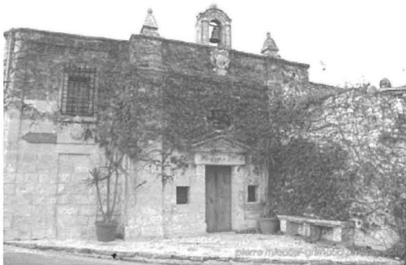
Il-Kappella ta’ San Ġorġ Martri fil-Wardija.