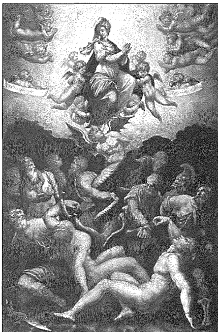
GIORGIO VASARI "Immacolata Concezione"