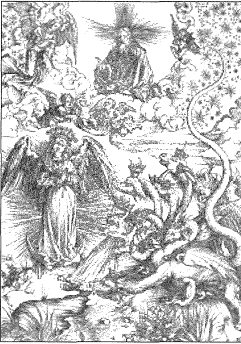
AWTUR MHUX MAGHRUF Santa antika – “Il-Mara u d-Dragnun”

mitologiku u xejn anqas, imma l-Insara meta kienu jaqraw dawn il-kapitli tal-Apokalissi dlonk kienu jintebhu li t-tifsira tagħhom hija li hemm Alla wiehed li lilu biss għandek tqim u tadura, l-allat l-oħra li jissuġġerixxi l-Imperu huma fasulli bhad-draguni.