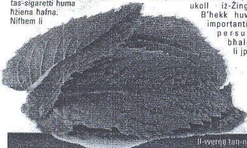
Il-werqa tan-nagħmiegħ tghin għal riha friska fil-halq

L-ewwel haġa kif taf l-effetti tas-sigaretti huma hżiena hafna. Nifhem li