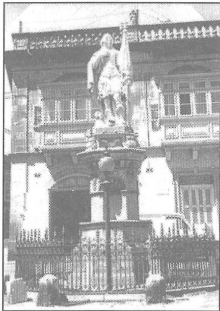
Triq San Bastjan: 1870: Indulġ. 5.6.1923

Ġieli n-niċċa tinzerta f'xi kantuniera, u jkun fiha daqqa t'għajn tassew sabiħa. Haġ' oħra wkoll: ftit huma n-niċċ li fil-quċcata ma nsibulhomx salib, biex ifakkruna li l-Megalomartri San Ġorġ u qaddisin oħrajn bħalu kisbu r-rebħ bis-saħħa tas-Salib. Ħafna min-niċċ issibilhom fanal quddiemhom, li llum jinxtegħel bl-elettriku, iżda dari bil-pitrolju, biex jikser id-dlam ċappa li kien ikun hawn bil-lejl. F'jum ta' festa, l-aktar nhar il-Festa tar-Raħal, kemm kienu jinxtegħlu sbieħ, nistħajjel, uħud min-niċċ, imdawrin bit-tazzi taż-żejt ikkuluriti! U kienet id-drawwa li l-irġiel, huma u għaddejjin, jaqilgħu minn rashom il-beritta u jerggħu jxidduha, biex isellmu lill-qaddis u jlissnu xi talba. Jispikka f'moħħi, għax jispikka fl-iskrizzjoni ta' taħt uħud min-niċċ tagħna, isem l-Isqof Qormi Carmelo Scicluna li mitt sena ilu ħarġilhom l-Indulġenza. Eqreb lejna, taħt tliet niċċ ta' San Ġorġ, l-Indulġenza ħariġha l-Isqof Dom Mawru Caruana xi sebghin sena ilu. Iggib ukoll isem l-Isqof Caruana, bid-data tal-5 ta' Ġunju 1923, l-Indulġenza mogħtija lill-istatwa l-kbira, skolpita fl-1870, ta' San Ġorġ li hemm fil-wesgħa tan-naħa ta' fuq, ġo Triq San Bastjan.