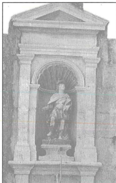
71, Triq il-Barrakki: ilu li sparixxa!

Nistaqsi: Habbewh missirijietna lil San Ġorġ? It-twegiba tkun tiegħek, int u tifli din il-lista tad-29 niċċa li għandna f'għiehu, imxerrdin maż-żewġ parroċċi ta' Belt Twelidna. Aghdirni jekk tinzerta xi indirizz ta' illum ma jaqbilx għal kollox ma' tas-sena 1978 meta jien għamilt dan it-tiftix dwar ir-Raħal u dwar Ġorġi tagħna.