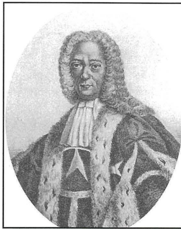
Il-Gran Mastru Emanuel Pinto de Fonseca li aċċetta li Ħal Qormi jsir belt u li tah ismu stess