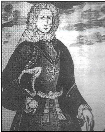
Il-Baruni Ferdinand Ernst von Stadl, is-Seniskalk tal-Ordni ta' San Ġwann, li kiteb memorjal favorevoli dwar Ħal Qormi

popolazzjoni ta' Ħal Qormi bejn l-1734 u l-1747 kienet hekk: fl-1734 – 3,750; fl-1736 – 5,403; fl-1740 – 5,928; fl-1741 – 6,043; fl-1745 – 6,134; u fl-1747 – 3,406. Ninnutaw il-qabza kbira 'l isfel bejn is-snin 1745 u 1747 u li f'dawn is-snin, ma kienx hawn xi mxija li qatlet eluf ta' nies, izda l-ħajja baqgħet miexja normali.