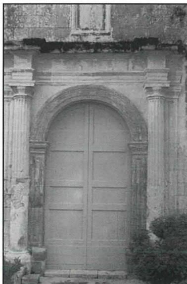
Il-bieb ewlieni tal-Knisja l-Qadima tas-Salvatur, l-ewwel knisja parrokkjali ta' Hal Lija.

L-Għaqda Soċjo-Mużikali Anici sselem u tferrah