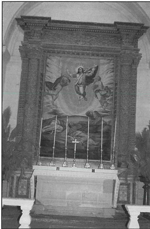
L-artal maġġur tal-Knisja l-Qadima tas-Salvatur f'Hal Lija. Ninnotaw, appartni l-pittura titolari tat-Trasfigurazzjoni ta' Ġesù li ma tantx hi ta' preġju artistiku, il-prospettiva rfinuta tal-artal li hu tal-ġebel u mdawwar bil-balavostri bħalma kien fi żmien il-Kappillan Dun Mario Grech.

tal-pesta. Hal Lija kienet batiet minn din l-imxija fl-1592/3 u, minhabba f'hekk, nibtet f'dan il-lokal id-devozzjoni lejn dawn iż-żewġ qaddisin li kellhom ukoll artal fil-knisja parrokkjali ddedikat lilhom.