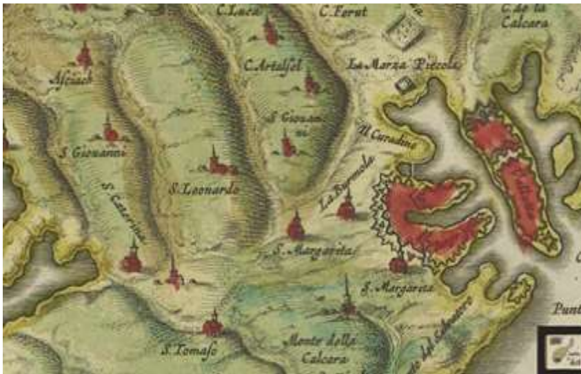
Mappa antika li tindika il-kappella ta' S. Leonardo

Mill-ħamrija ta' madwar din l-istruttura gbarna xi biċċiet tal-fuħħar li sibna fil-wiċċ u minn analiżi preliminarja jidher li xi wħud mill-biċċiet kienu ta' żmien l-Ordni. Żgur li dawn l-għelieqi jeħtieġ jġu studjati aktar bir-reqqa u possibilmment isiru xi skavi arkeoloġiċi biex naraw jekk il-binja li għad hemm tistax tkun parti mill-Knisja ta' San Leonardu, jew jekk għadx hemm xi fdalijiet minn din il-knisja moħbija taħt il-ħamrija. Li hu żgur, hu l-fatt li f'dawn l-inħawi kienet teżisti knisja li qatt ma smajna dwarha qabel. Għalkemm li l-kult ta' San Leonardu fiż-Żejtun ma nsibuh imkien, irridu ngħidu li fil-knisja parrokkjali ta' Ħal-Tarxien hemm artal iddedikat lil dan il-qaddis.