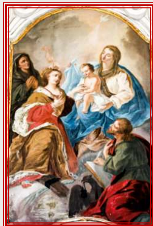
Titular : iż-Żwieg Mistiku ta' Santa Katarina - 1776 skola ta' Francesco Zahra