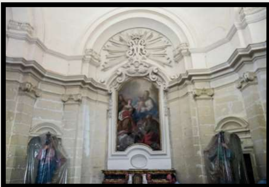
Perspettiva tal-artal ewlienu u t-titular