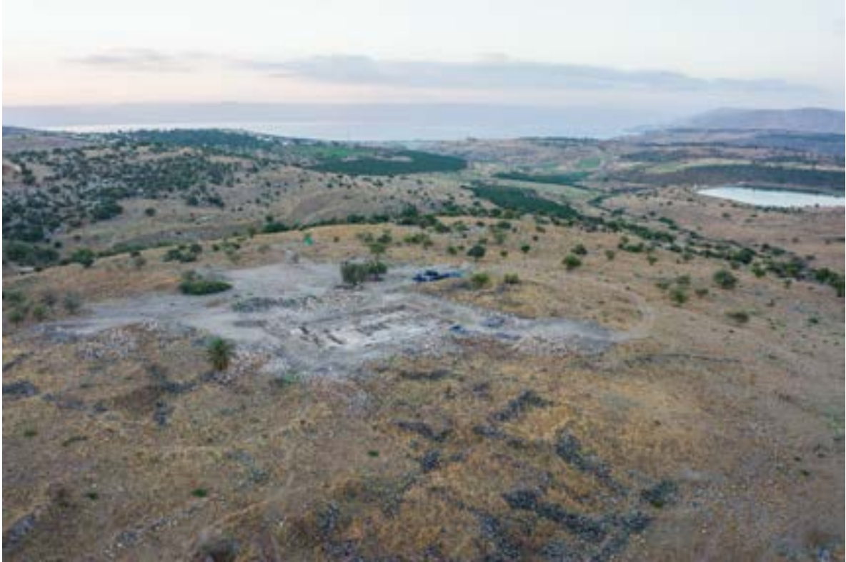
الشكل 1. صورة جوية لموقع حوقوق

مقدمة بخرية قرية يقوق من القرنين التاسع عشر والعشرين، تقع خربة حوقوق في شرقي الجليل الأسفل، وتبعد نحو 6 كم شمال غرب بحيرة طبريا. يتواجد الموقع على قمة تلّ منخفض محاط بمنحدرات تسمح بالعمل الزراعي وغربها وادٍ خصب (شكل 1). يوجد على طرف التلّ الشمالي نبع عين حوقوق. بقايا المستوطنة القديمة، التي تقدّر مساحتها بأكثر من 30 دونمًا، مغطاة جزئيًا والتي كانت قائمة حتى عام 1948. تاريخ الموقع حسب المصادر التاريخية ذُكرت حوقوق لأول مرّة في المصادر الأدبية في سفر يشوع 19: 33 " وَكَانَ تُخْمُهُمْ مِنْ حَالَفٍ مِنَ الْبَلُوطَةِ عِنْدَ صَعَنْتَيْمَ وَأَدَامِي النَّاقِبِ وَيَبْنِيئِيلَ إِلَى لُقُومَ. وَكَانَتْ مَخَارِجُهُ عِنْدَ الْأُرْدُنِّ ". 19: 34 " وَرَجَعَ التُّخْمُ غَرَبًا إِلَى