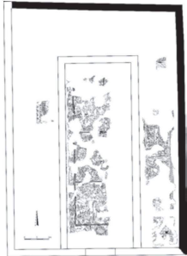
الشكل 4. مخطط للكنيس مع الفسيفساء

لم يُعثر تحت أرضية فسيفساء الكنيس على أي دليل لوجود كنيس أقدم، أو أرضية أقدم من أرضية الكنيس. عثر على جدار قديم ويختلف في شكل بنائه واتجاهه تحت الرواق الشمالي للكنيس، يبدو أنه تابع لبقايا مبنى قديم لا نعرف وظيفته وتاريخه. وعثر فوق أرضية الفسيفساء في الطرف الجنوبي من القاعة المركزية على حجرين مصقولين متجاورين، اللذين شكّلا درجة