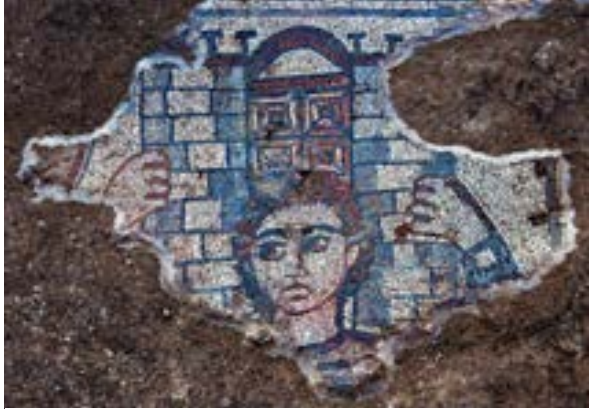
الشكل 6. شمشون حاملاً بؤابة غزة (جيم هيرمان)

3:15، التي تصوّر شمشون وهو يهرب من غزة، حاملاً بؤابة المدينة على كتفيه (الشكل 6).