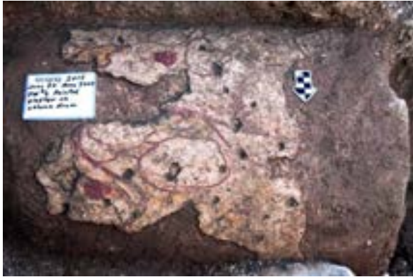
الشكل 30. فقرات عمود من الكنيس مقصورة بالجص بأساس السطيلوباط من العصور الوسطى