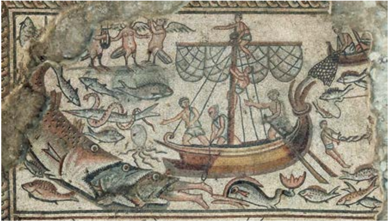
الشكل 21. لوحة يونس والسمك

بحري لها ذيل سمكة (الشكل 18). تحته يبقى فقط جزء من اسم الشهر نوفمبر. حظ الشهر أكتوبر وتحته يظهر العقرب أمام صدر رجل. وحظ شهر سبتمبر