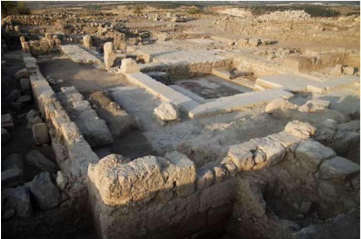
الشكل 28. المكن الشمالي الشرقي للكنيس والمنصة من العصور الوسطى

واحدة على الأقل في الجدار الغربي. القاعة المركزية منفصلة عن الأروقة من الجوانب الشرقي، الشمالي