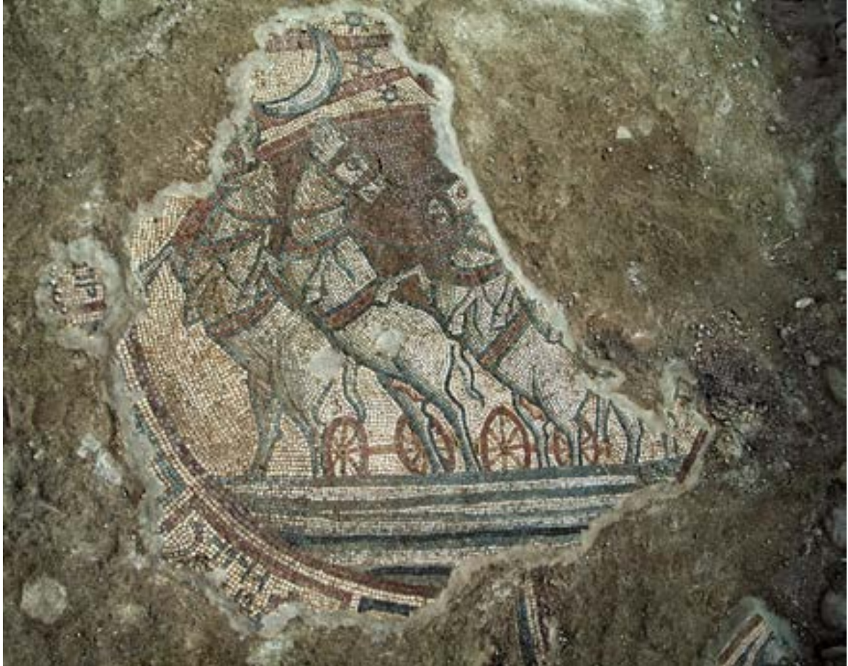
الشكل 17. قسم من عربة هيلوس فيه أربع عجلات العربة وخيول بيضاء

حُفظ في الدائرة الداخلية بفسيفساء حوقوق، قمر، نجوم، أشعة شمس وعربة ذات أربع عجلات مرتبطة بأربعة خيول بيضاء (الشكل 17). بسبب الأضرار التي لحقت بشخصية هيلوس سائق المركبة، فلا نعرف إذا تمّ تصويره كتجسيد لإله الشمس اليوناني - الروماني (كما في كنس حمامات