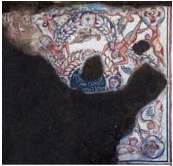
الشكل 8. لوحة التكريم، ميدالية عليها نقش باللغة

عُثر شمالي فسيفساء شمشون والثعالب، على لوحة مربعة وفي مركزها ميدالية عليها نقش باللغة العبرية (الشكل 8).