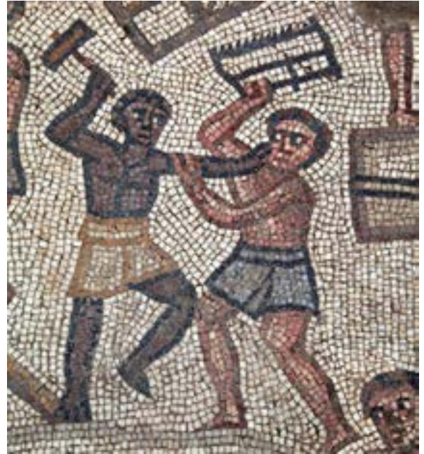
الشكل 24. لوحة برج بابل، شجار ناشب بين العمال

الفوضى والعنف الواردان في اللوحة هما ردّ الله على خطيئة الغطرسة البشرية. العمال المتميزون عن بعضهم البعض من خلال تسريحات الشعر واللحي والملابس وحتى لون بشرتهم، يمثلون شعوبًا مختلفة. وتظهر نتائج العقوبة عن طريق سقوط بعض العمال