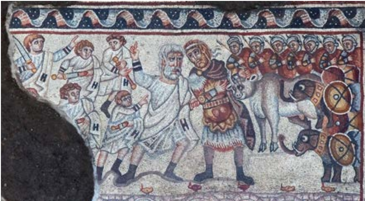
الشكل 13. لوحة فسيفساء الفيلة، الشريط العلوي