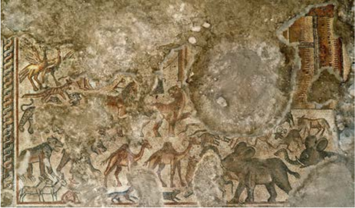
الشكل 14. لوحة سفينة نوح

والمبنى غير واضحة لأن جزءًا من الفسيفساء الذي يربط بينهما قد تضرر بسبب حفرة متأخرة.