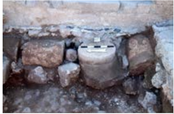
الشكل 29. فقرات عمود من الكنيس تدعم أساس السطيلوباط من العصور الوسطى