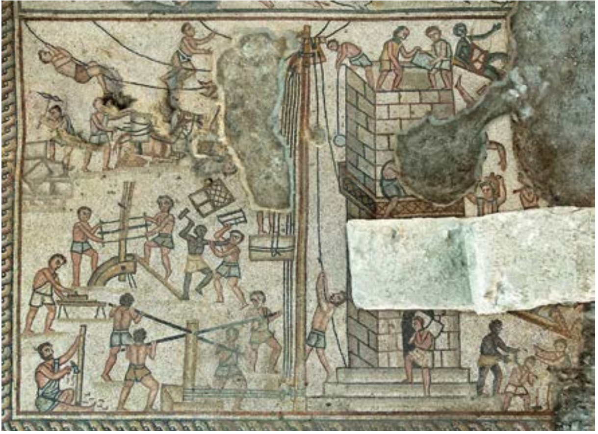
الشكل 23. لوحة برج بابل

الصارى. شكلها الهجين وسحابة العاصفة وعرض الموسيقى لا تدع مجالاً للشك في أن الإشارة إلى صافرات الإنذار. ومع ذلك، هذا هو أول وصف حقيقي لقصة يونس وجدت حتى الآن في زخارف الكنيس.