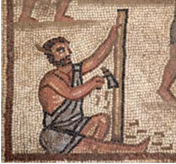
الشكل 26. لوحة برج بابل، نجار يقشر عرضة

إلى عواقب وخيمة للخطرسة البشرية، المنقسمين وفق لغتهم وأصلهم.