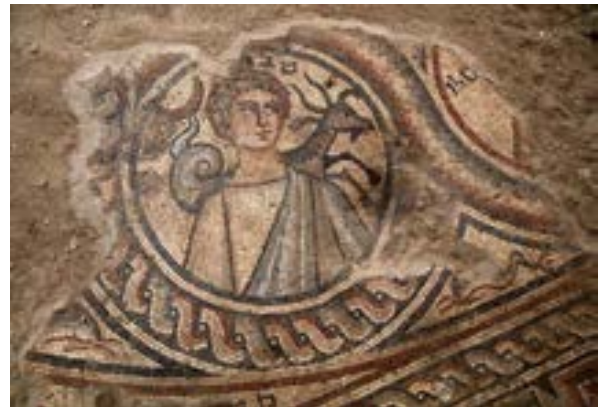
الشكل 18. شهر ديسمبر، ماعز بحري لها ذيل سمكة

تظهر رموز الأبراج لأشهر السنة في اثنتي عشرة دائرة متشابكة بعضها ببعض حول الدائرة المركزية. وتعرض الأشهر التي حفزت في هيئة شباب، مصحوبة بأسماء الأشهر بالعبرية ورموز مطابقة للأشهر. ويظهر وراء كتفي الرجل في شهر ديسمبر، حظ الشهر برمز ماعز