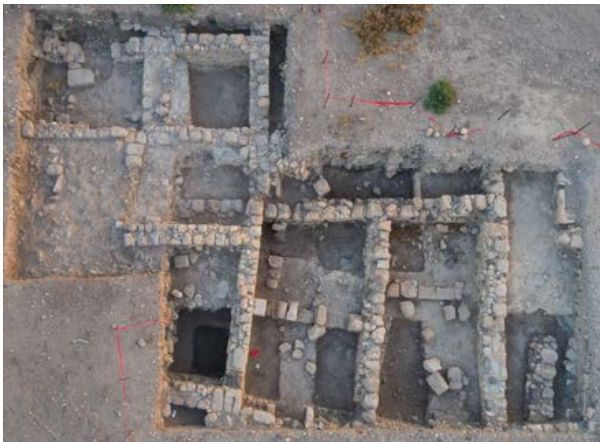
الشكل 3. صورة جوية لبقايا المباني السكنية بمنطقة 2000

تتكون كل وحدة من غرفتين متجاورتين. في النصف الثاني من القرن الخامس الميلادي، أضيفت إلى مجمّع الأبنية غرف من الغرب، الشمال والشرق. بنيت جدران البيوت من حجارة الحقل وبعضها مصقولة، وحُفظت جزئيًا على ارتفاع يزيد عن مترين. مسطبة الغرف مصنوعة من الجص أو التراب المضغوط (الشكل 3). الموجودات النباتية القديمة إلى وجود كميات كبيرة من نواة الزيتون المطحون ونبات الخردل. لم يعثر على أي إشارات للدمار في منطقة 2000، فقد هجر المجمعان السكنيان في نهاية القرن السادس وبداية القرن السابع الميلادي. بمرور الوقت، انهارت المباني، فسقطت الأسطح أولاً ثم الجدران. تراكمت