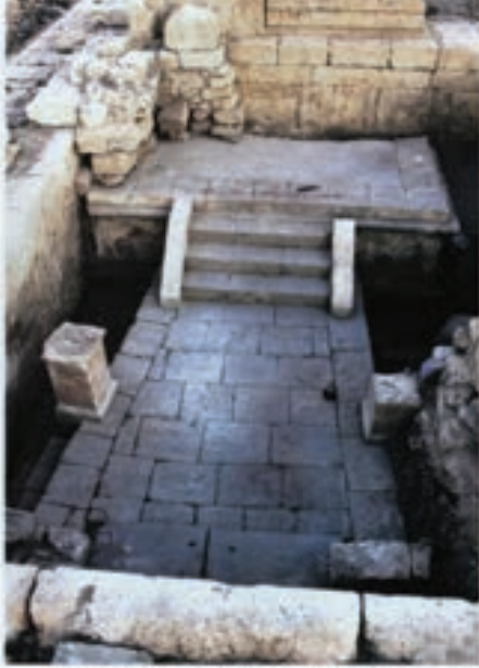
صورة الغلاف الخلفي: معبد عومريت