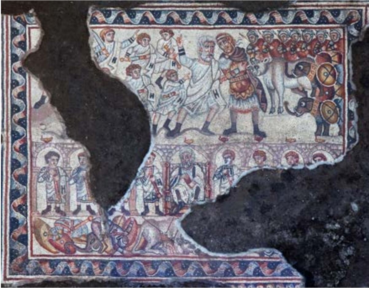
الشكل 12. لوحة فسيفساء الفيلة