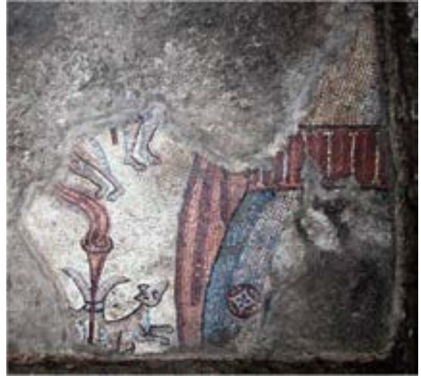
الشكل 7. شمشون والثعالب

كل كرة مرفوعة بيد شخصية عارية ومجتمحة (كوبيدون). ربما يخلد النقش في وسط اللوحة، التي بقي جزء منها فقط، بناء الكنيس وتتضمن مباركة للذين يحرصون على الوصايا، أو الذين تبرعوا لمشروع البناء.