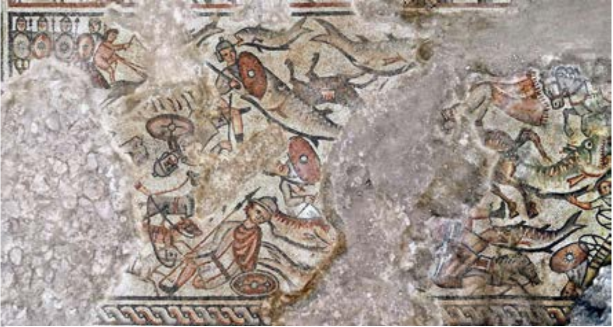
شكل 15. لوحة غرق جيش فرعون

أفراد آخرين يعاقبهم الله على كبريائهم، بما في ذلك جيل الطوفان وبناء برج بابل، وهي قصص مصوّرة أيضًا في فسيفساء القاعة المركزية بكنيس حوقوق.