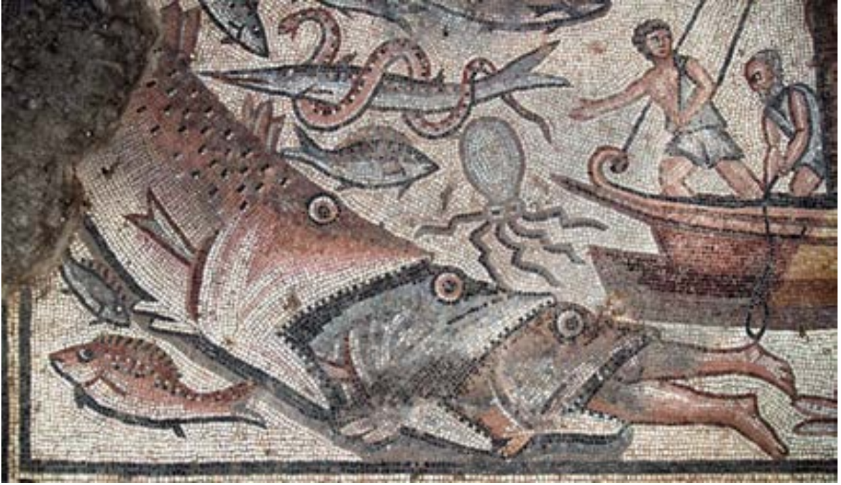
الشكل 22. ثلاثة أسماك تبتلع يونس

وصفت القصة في ديكور مليء بأشكال بحرية، وتتضمن مشاهد من الحياة اليومية في البحر: أعلى اليمين، قارب صيد صغير وصياد يلقي الشبكة؛ في الأسفل، صيادان، يرتديان ثيابًا قصيرة، يعصران شبكة صيد مبللة بالماء. في وسط المشهد سفينة شراعية كبيرة بطاقم من خمسة بحارة، اثنان يتسلقان الصارية. رجل ملتج ونصف أصلع في وسط السفينة - ربما القبطان - ينزل حبلًا في الماء وبطرفه حلقة. أسفلها تظهر رجلا يونس بارزة من فم سمكة كبيرة، التي تبتلعها سمكة أكبر منها، وهذه تبتلعها سمكة أكبر (الشكل 22).