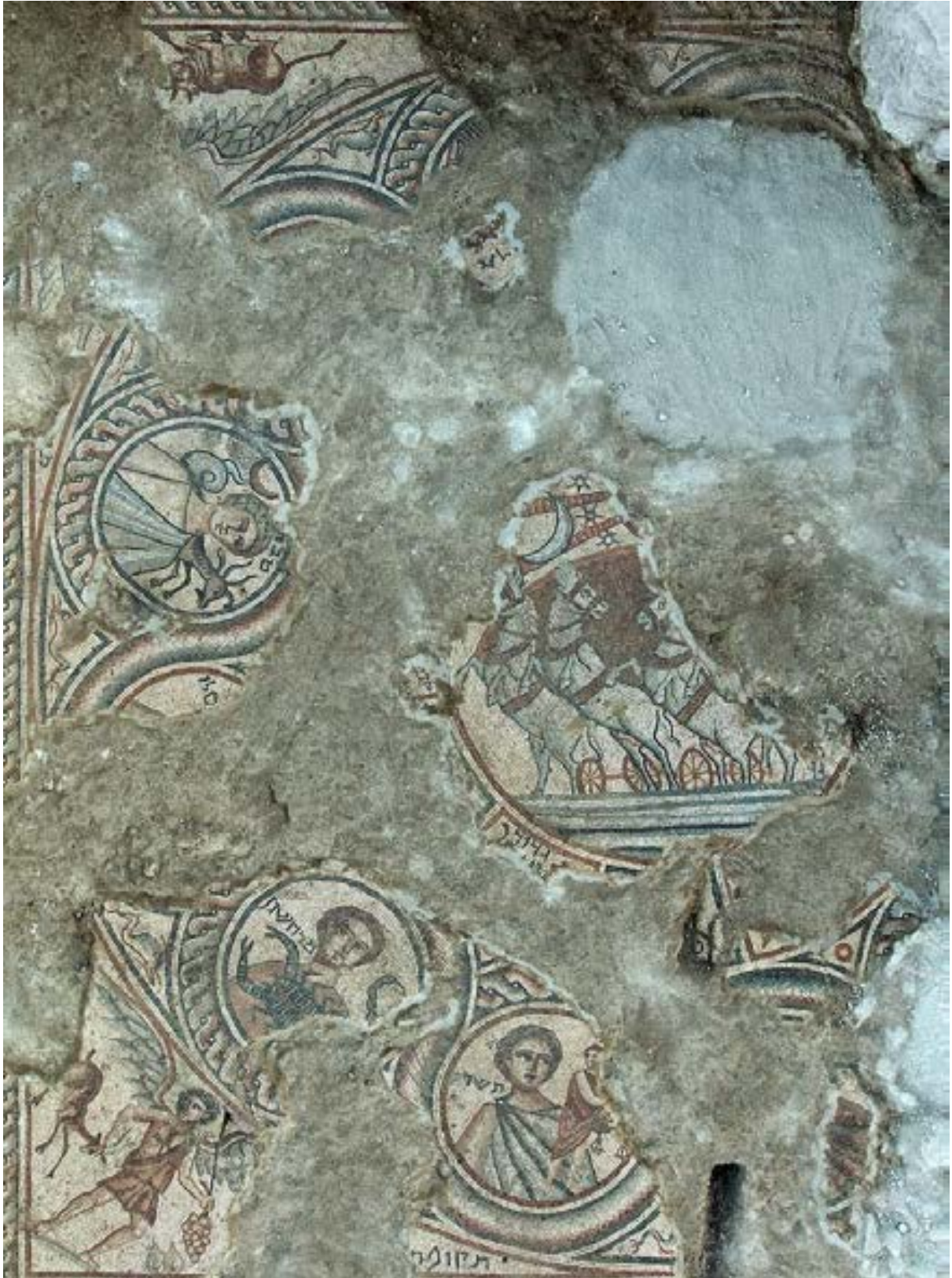
الشكل 16. هيلبوس وأبراج الحظ