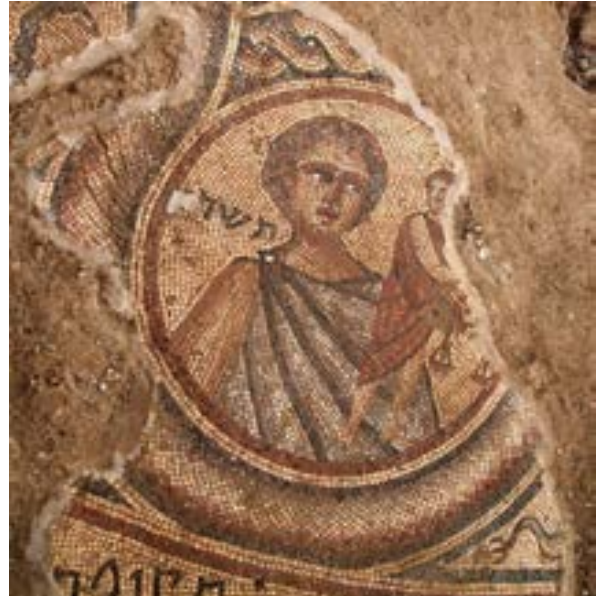
الشكل 19. شهر سبتمبر رجل صغير يحمل الميزان

يظهر على هيئة رجل صغير يحمل الميزان، تجسيدًا للعدالة (شكل 19).