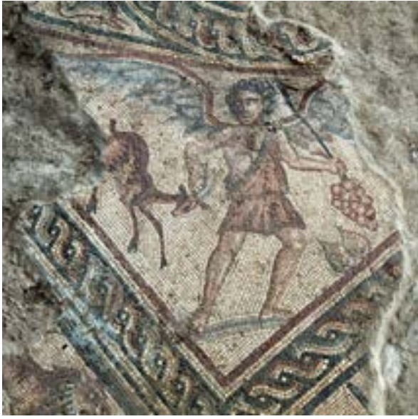
الشكل 20. فصل الخريف - في الركن الجنوبي الغربي

يظهر على هيئة رجل صغير يحمل الميزان، تجسيدًا للعدالة (شكل 19).