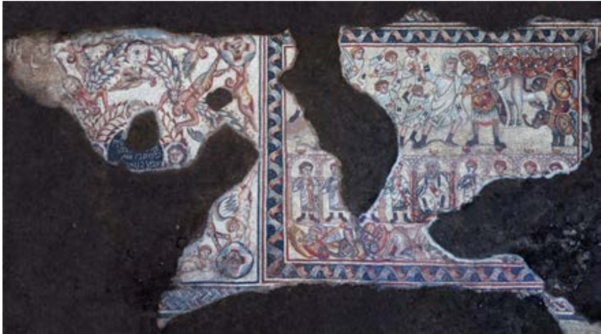
الشكل 11. لوحة فسيفساء الفيلة

توجد شمال لوحة التكريم لوحة كبيرة غير عادية من كافة النواحي - فسيفساء الفيلة (الشكل 11).