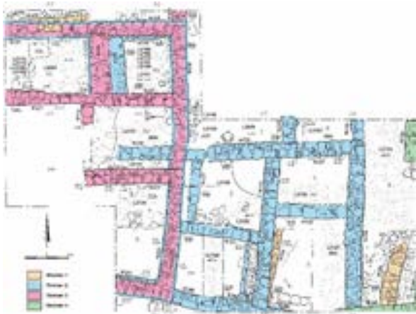
الشكل 2. خارطة مخطط المباني السكنية بمنطقة

كشفت الحفريات الأثرية في أنقاض القرية القديمة (منطقة 2000) مجموعة أبنية تابعة لوحدين سكنيتين منفصلتين، تم بناؤهما في بداية القرن الخامس الميلادي، نحو زمن بناء الكنيس: الوحدة 1 (الغربية) والوحدة 2 (الشرقية) لهما جدار مشترك (الشكل 2).