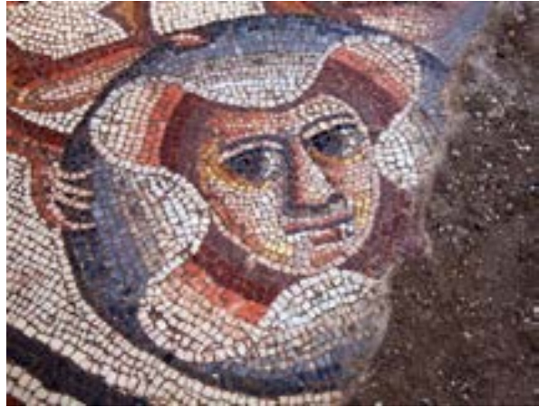
الشكل 10. لوحة التكريم، كرات داخلها وجوهاً بشرية أو أقنعة

ينقسم الوصف في اللوحة إلى ثلاث أشرطة التي تتسع في الأعلى. يبدو أن هذه قصة تم تصوير ذروتها في الشريط العلوي، في المواجهة بين الشخصين الضخمين (الشكل 12).