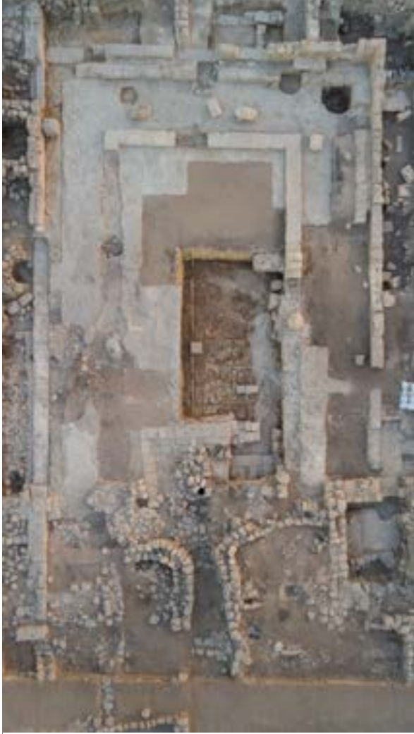
الشكل 5. صورة جوية لمنطقة الكنيس (جريفين هايجر)

للمبنى العام في العصور الوسطى بني على الجدار الغربي للكنيس (الشكل 5).