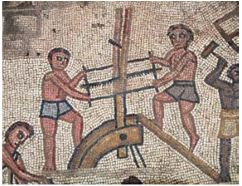
صورة الغلاف الأمامي: لوحة فسيفساء من أرضية الكنيس بحقوق