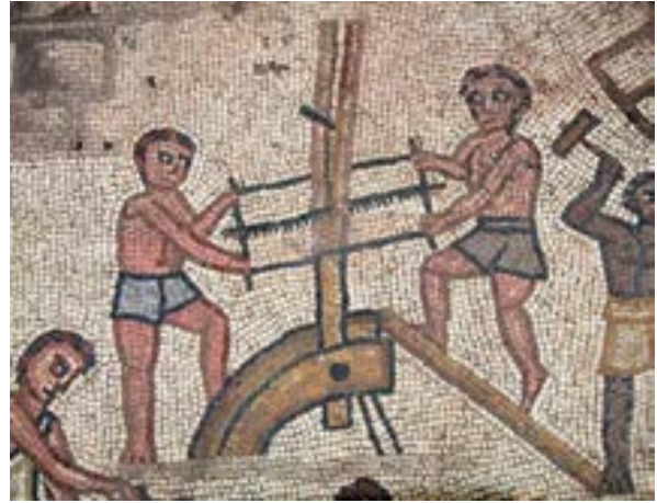
الشكل 25. لوحة برج بابل، نجارين ينشرون عامود

في وسط المشهد يجري بناء برج مربع. جوانب مختلفة من عملية البناء، بما في ذلك قطع الحجارة والنجارة (الأشكال 25، 26) ونظام معقد من البكرات يعرض حول البرج. ما يماثل مشهد برج بابل معروف فقط في كنيس وادي الحمام حيث البرج هناك مضلّع وليس مربعًا.