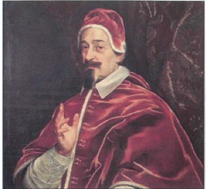
Fabio Chigi – Inkwiżitur ta' Malta bejn 1634 u 1639 u li wara laħaq Papa Alessandru VII.

Fi żmien il-Kavallieri f'Malta kien hawn l-Inkwiżizzjoni. Din kienet qorti li tgħarbel lill-Maltin biex tara għadhomx iħaddnu l-fidi Nisranija. Dawk kollha li kien jaqa' suspett fuqhom kienu jittieħdu quddiem l-Inkwiżitur u jekk jinstabu ħatja jiġu kkastigati. Din il-qorti turina ħafna dwar il-ħajja tal-iskjavi.