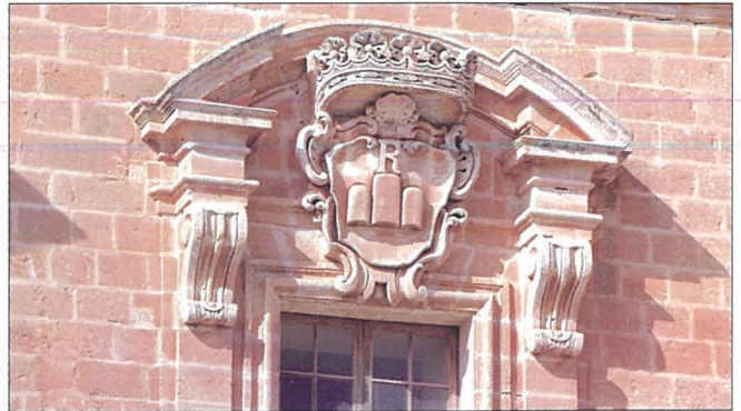
L-arma tal-Monte Della Redenzione fuq il-Palazz ta' Selmun. Il-palazz kien għadu ma nbeniex meta twaqqfet il-Monti.