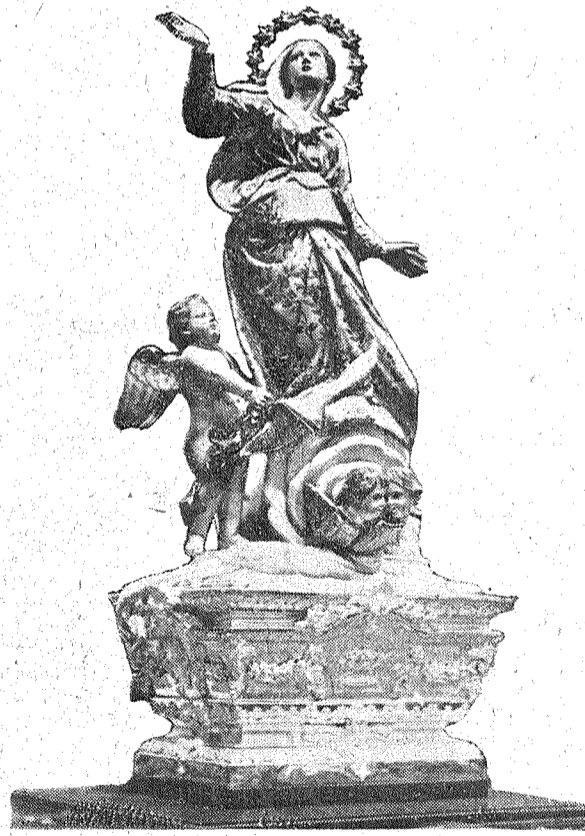
IL VARA TAL MQABBA.

F'Malta, Tlugh is-Sema tal Madonna hu wiehed mill aqwa ghejjieda ta ma tul is-sena. Din il qima taghna l'Maltin lejn Tlugh is-Sema tal Madonna aktarx tniisset fostna mill'Insara ta Gerusalem li, kif jidher f'bosta hwejjeg, kellna wisq x'naqsmu magħhom, u xrobn bosta minn drawwiethom fl'ewwel zmienijiet tal Knisja, meta ma