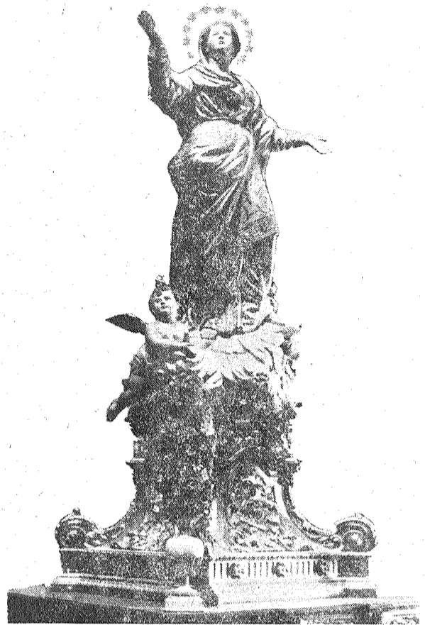
IL VARA TAL QRENDI.