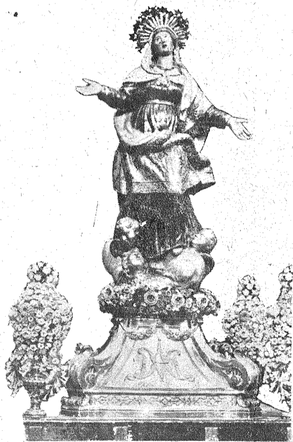
IL VARA TAL GUDJA.