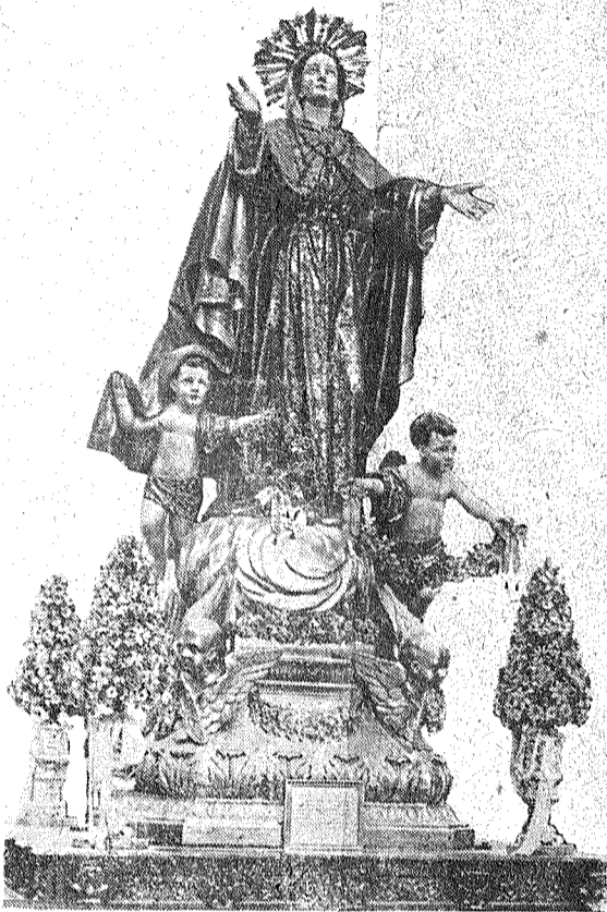
IL VARA TAL MOSTA.