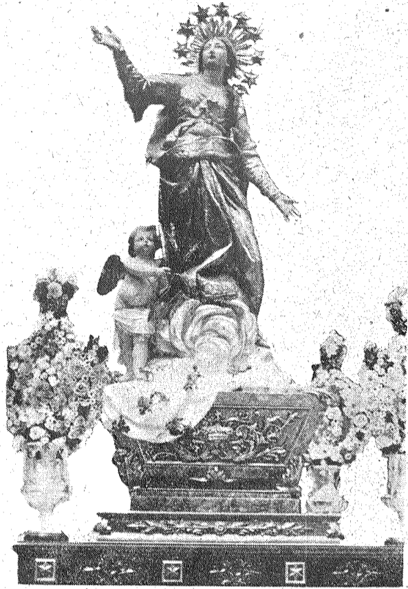
IL VARA TA HAL ANIAQ.

in-nies li jgħihom quddiem ghaj-nejhom dawna l'hsiebijiet sbieh! In-nies ta zmienijietna il ghid tal-qaddis jghoddu bhala jum ta xal-lar, billi jieklu u jixorbu zejjed, u johorgiu jiddandnu mat-triqat.