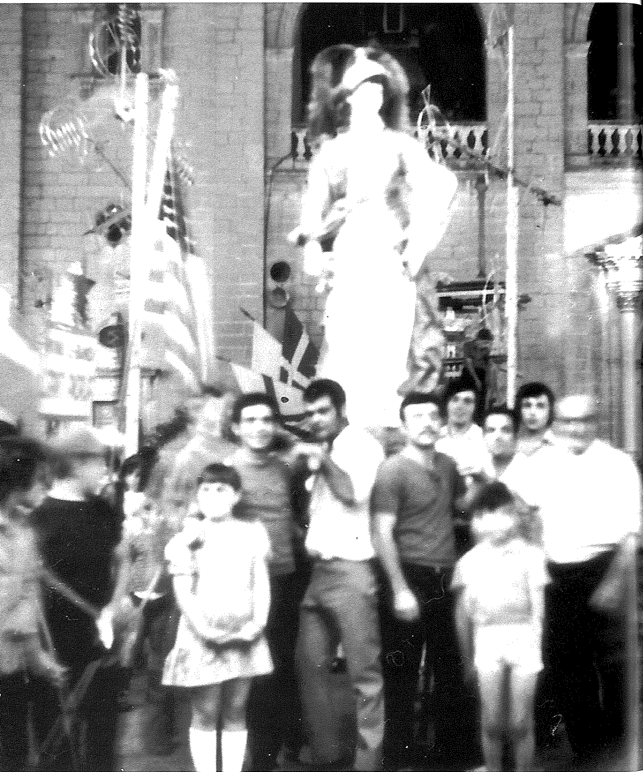
Żewg ritratti li juru membri tal-Għaqda Mużikali Sant'Andrija qabel il-marċ ta' lejliet il-festa flimkien mal-istatwa ta' Malta Gwerriera u t-tluġh brijjuż tal-Istatwa fuq il-kolonna tagħha fl-1969