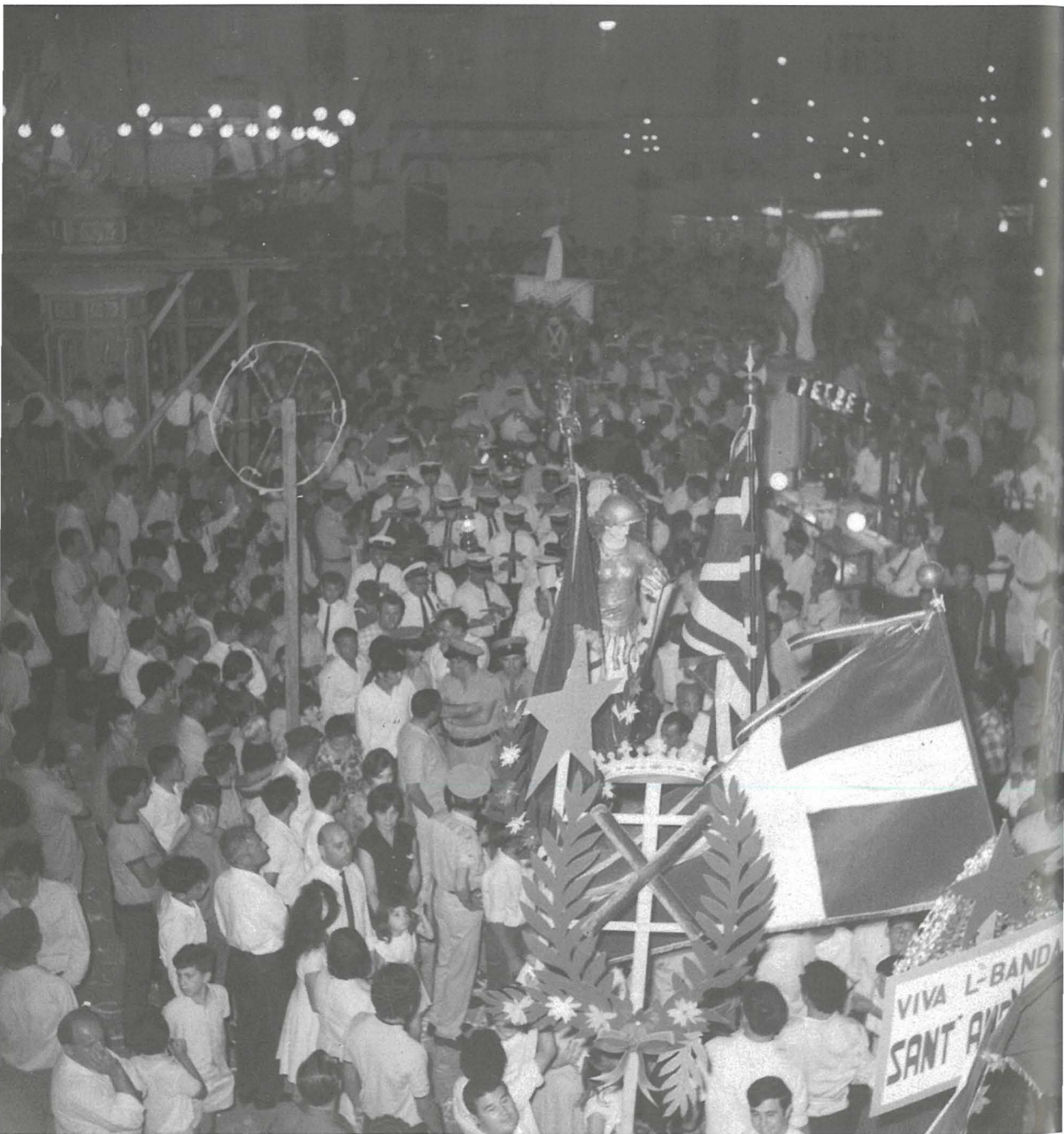
L-istatwa ta' Malta Gwerriera f'nofs il-marċ tradizzjonali mill-Bandiera Sant'Andrija lejliet il-festa tas-sena 1969 qabel ittellgiet fuq il-pedestall taghha.