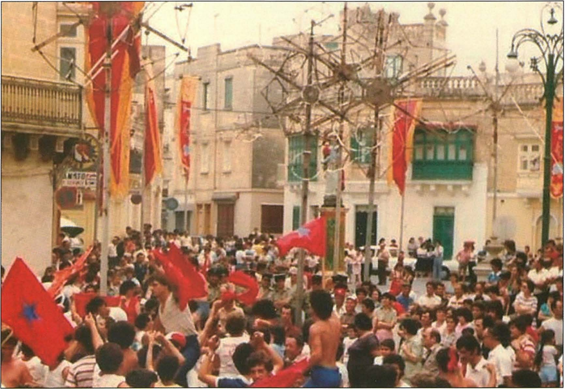
Fl-okkażjoni tal-festi speċjali li saru f'għeluq il-mitt sena mit-twaqqif tal-Għaqda Mużikali Sant'Andrija, l-istatwa ta' Malta Gwerriera ntramat f'nofs il-Pjazza Sant'Andrija fuq il-pedestall tal-istatwa ta' Maximilla