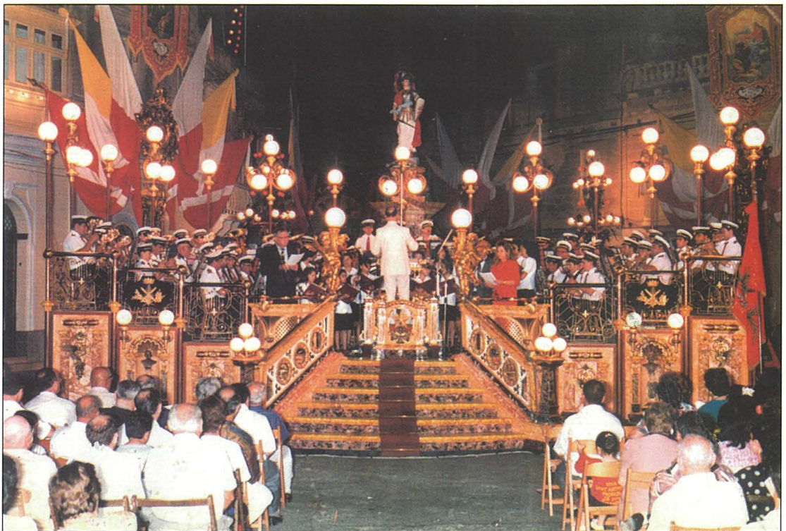
L-istatwa ta' Malta Gwerriera kif tintrama llum f'nofs Misrah il-Knisja