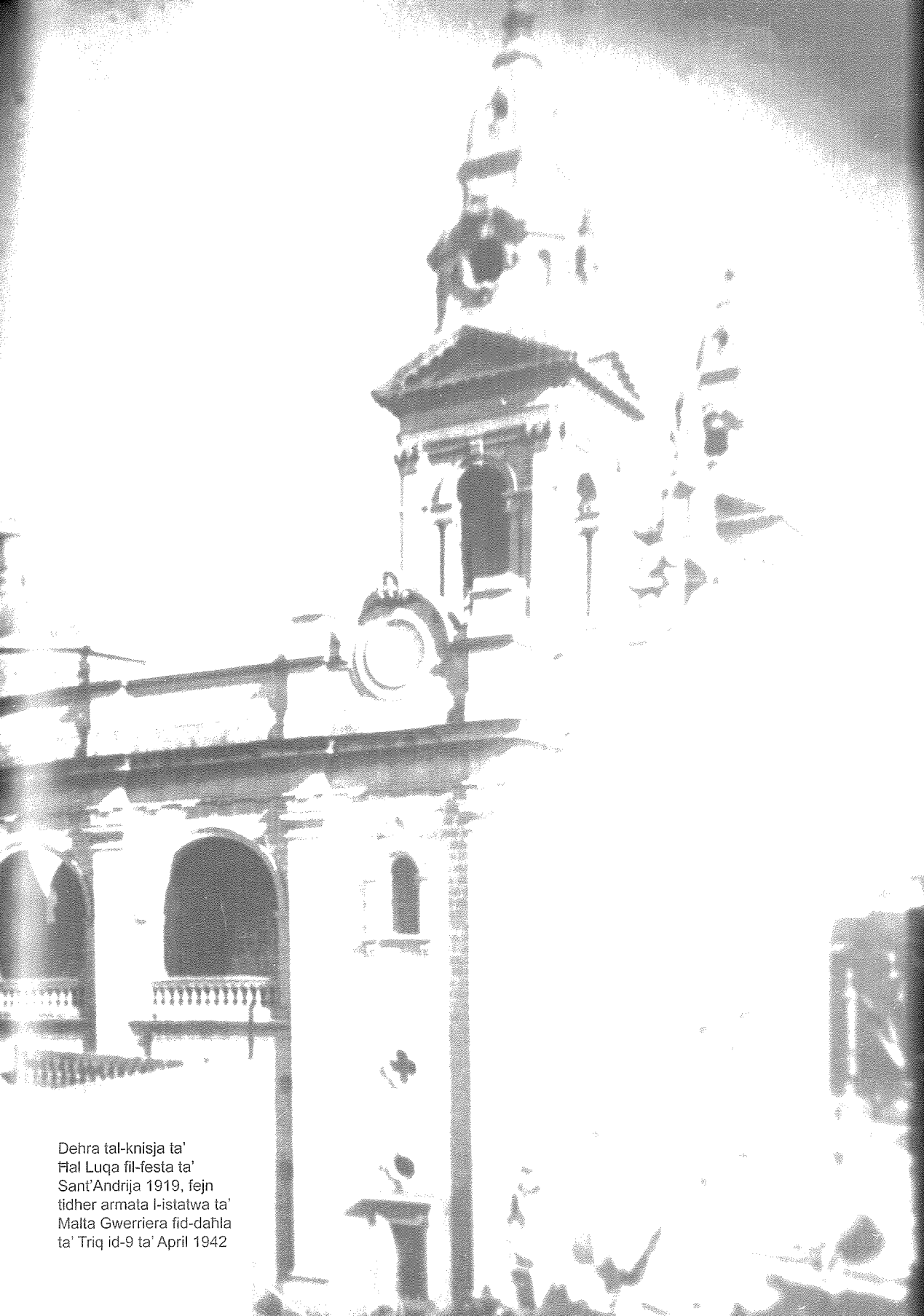
Dehra tal-knisja ta' Ftal Luqa fil-festa ta' Sant'Andrija 1919, fejn tidher armata l-istatwa ta' Malta Gwerriera fid-dahla ta' Triq id-9 ta' April 1942