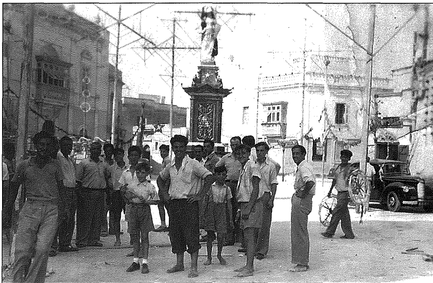
L-Istatwa ta' Malta Gwerriera armata f'nofs Misrah il-knisja fil-festi speċjali li saru fl-okkażjoni tas-sede l-ġdida tal-Ghaqda Mużikali Sant'Andrija f'Misrah il-Knisja - 1952

Eżamijiet tal-Periti, tah il-warrant ta' perit.