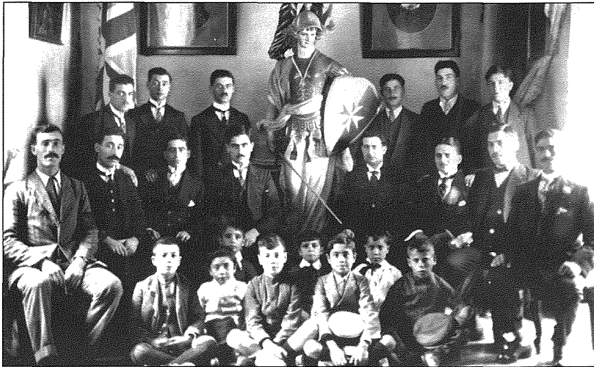
Dehra tal-istatwa ta' Malta Gwerriera fis-sala tal-każin mal-membri tal-kumitat u l-familjari tagħhom fis-sena 1916