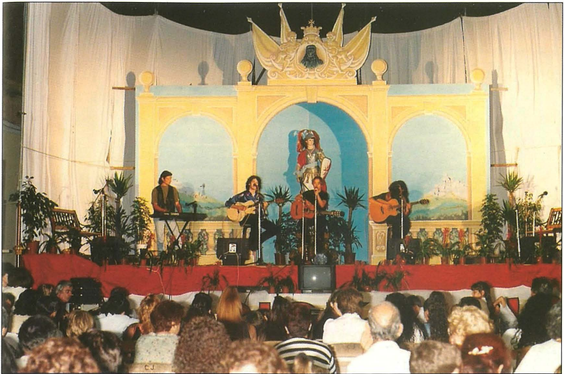
L-istatwa ta' Malta Gwerriera parti mix-xenarju ta' wahda mill-iljieli Maltin 'Lejla a' la Fhalluqija' fis-sena 1997