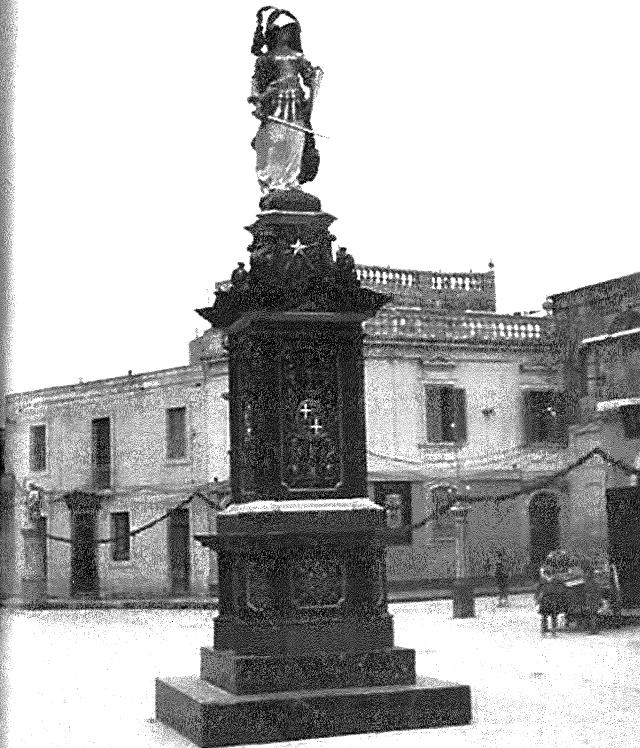
(Lemin) L-istatwa fi Triq ir-Rixtelli waqt il-marc ta' filghodu meta kienu saru festi speċjali fl-okkażjoni tal-ftuħ tal-każin il-ġdid u (fuq) l-istatwa ta' Malta Gwerriera armata f'nofs Misraħ il-knisja quddiem is-sede l-ġdida tal-Għaqda Mużikali Sant'Andrija