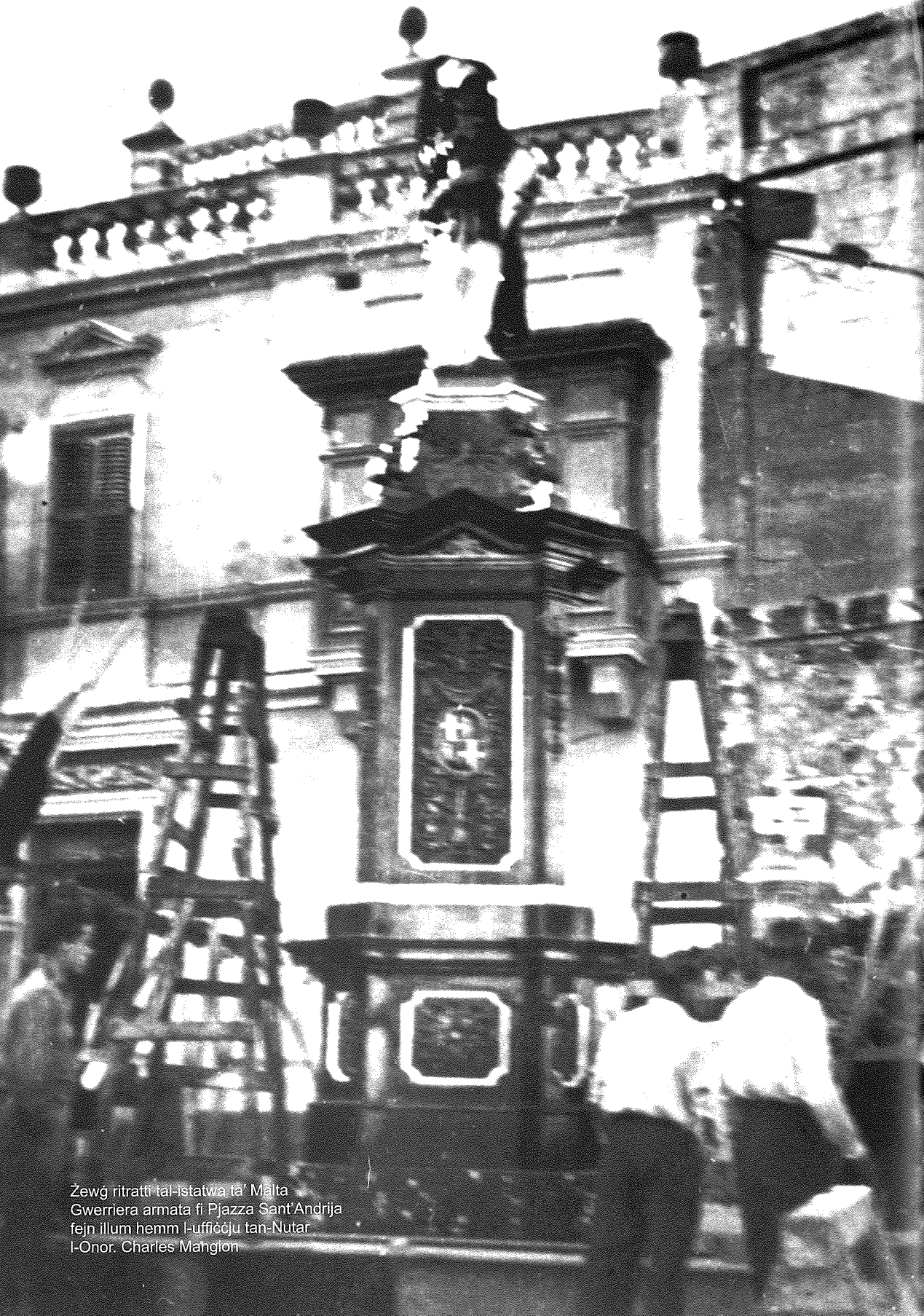
Żewg ritratti tal-Istatwa ta' Malta Gwerriera armata fi Pjazza Sant'Andrija fejn illum hemm l-ufficcju tan-Nutar l-Onor. Charles Mangion