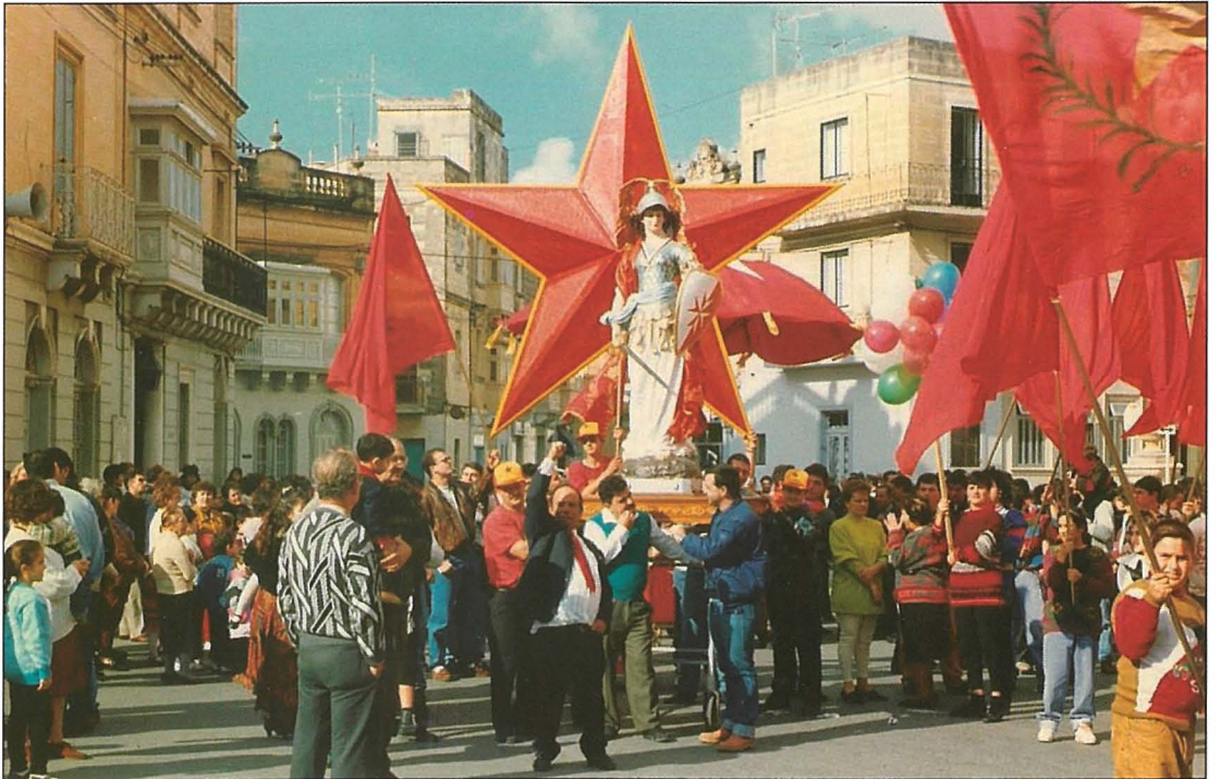
Marċ bl-istatwa ta' Malta Gwerriera waqt programm televiżiv "Il-Hadd mal-Maltin" li sar nhar il-Hadd 16 ta' Jannar 1994