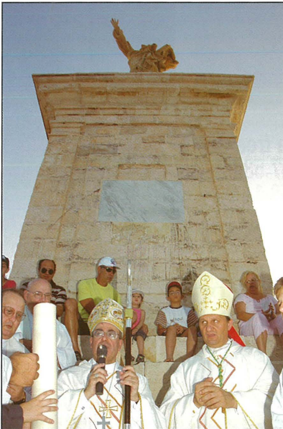
L-Isqfijiet iqaddsu taht l-istatwa ta' San Pawl fuq il-gżejjer li jgħibu ismu.