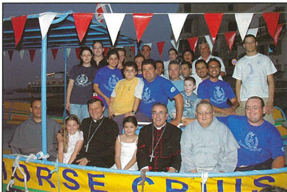
L-Isqfijiet mal-Kumitat tal-Festa fuq il-luzzu hdejn il-Menqa, San Pawl il-Baħar.

Din iċ-ċelebrazzjoni saret qrib il-bidu tas-Sena Pawlina mniedja mill-Qdusija Tiegħu l-Papa Benedittu XVI biex jiffakkar it-twelid tal-Appostlu San Pawl elfejn sena ilu.