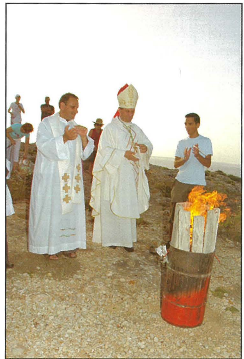
L-Isqof Mario Grech iqabbd il-ħuġġieġa.