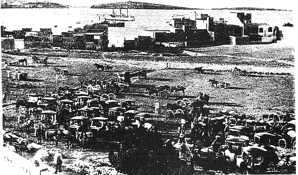
Il-Karozzini li kienu jġu San Pawl il-Baħar għall-festa. Ir-Ritratt meħud minn Villa Chapelle

darba minn Triq Parades u Triq it-Torri. Il-Poplu wera li ma kienx kuntent. Ried li l-purċissjoni tghaddi minn Triq il-Knisja u Triq Isouard. Is-sitwazzjoni rranġat fl-1974, fi żmien il-Kappillan P. Samwel Chetcuti u l-purċissjoni tal-festa għaddiet minn Triq Isouard, b'żieda ta' toroq oħra.