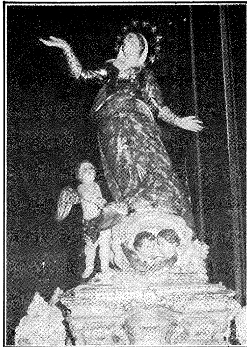
L-Istatwa tal-Madonna meqjuma fil-Parroċċa ta' l-Imqabba.