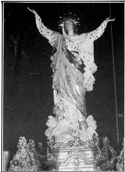
L-Istatwa tal-Madonna meqjuma fil-Parroċċa ta' l-Imġarr.