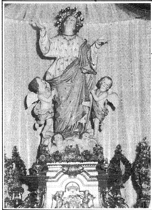
L-Istatwa tal-Madonna meqjuma fil-Parroċċa taż-Zebbuġ, Ghawdex.