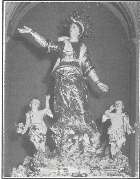
L-Istatwa tal-Madonna meqjuma fil-Parroċċa ta' Ħad-Dingli.

Kemm ippenetrat din id-devozzjoni fit-tradizzjoni reliġjuża ta' pajjiżna jidher mill-fatt li sa l-icken parroċċa li eżistiet sal-bidu tas-seklu XVII kollha kellhom jew xi