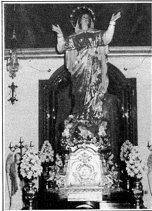
L-Istatwa tal-Madonna meqjuma fil-Knisja ta' Samra.