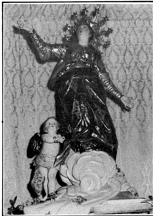
L-Istatwa tal-Madonna meqjuma fil-Parroċċa ta' Hal Ghaxaq.

jew ta' Ghadir il-Bordi kif ukoll żewġ knejjes oħra li darba kellhom din l-istess dedika; illum huma ta' San Pietru u tal-Belliegħa b'titlu tat-Twelid tal-Madonna; knisja oħra fl-istess parroċċa dedikata lill-Assunta hi ta' Marin id-Dona . F'Hal-Luqa hemm il-Knisja żgħira tal-ftajjar , fil-waqt li kemm l-Imġarr kif ukoll il-Mosta il-parroċċa hi dedikata lil Santa Marija. Fil-limiti tal-Mosta, fit-triq lejn l-Imdina, imbagħad hemm il-kappella ta' Żeffi , fil-waqt li knisja oħra f'dan ir-raħal, dik ta' dhib , illum tal-Viżitazzjoni, darba kienet tal-Assunta. Fl-Imqabba il-festa tal-parroċċa hi Santa Marija; f'dan ir-raħal ukoll hemm knisja, dik tad-Duluri, li darba kienet ta' l-Assunta. Fil-limiti tan-Naxxar, dik ta' Hal Misilmet jew tax-Xaghra , li llum nafuha b'tal-Grazzja, darba kienet dedikata lill-Assunta; tant hu hekk li l-festa għadha ssir sal-lum fil-15 t'Awissu. Fil-limiti ta' l-istess raħal hemm ukoll dik tal-Mghatab . Fil-limiti ta' Hal Qormi nsibu dik tal-blat jew tal-wied , dik ta' Qrejċa , il-famuża knisja ta' Hlas , kif ukoll dik tas-Samra jew ta' Atocja , illum parti mill-Hamrun. Mill-knejjes ta' Santa Marija li ntemmu f'Hal Qormi kien hemm