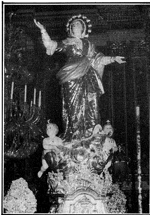
L-Istatwa tal-Madonna meqjuma fil-Parroċċa tal-Qrendi.

X'baqa' llum minn dan l-għadd kollu ta' knejjes u kappel medjevali? Mhux wisq, billi hafna ma baqghux jiehdu hsiebhom u ġew iprofanati kanonikament, aktarx fis-seklu XVII. Minn dawk li baqghu, kien hemm oħrajn li bidlu d-dedika tagħhom. Dawk li għad hemm illum huma: f'Ħ'Attard il-parroċċa u f'Ħal Balzan knisja żgħira n-naħa ta' fuq tar-rahmal, f'Birkirkara il-parroċċa l-qadima kif ukoll dik tal-herba li llum m'għadhiex dedikata 'l Santa Marija, f'Ħad-Dingli il-parroċċa li diġa' kienet tissemma minn Duzina fl-1575; (fl-1636 kienet titqies "qadima bosta" u kellha 5 arkati u fl-1678 twaqqfet parroċċa mill-ġdid minflok Santa Duminka ta' Ħal Tartarni). F'Ħal Gharghur insibu tnejn, jiġifieri Santa Marija ta' Żellieqa u ta' Bernarda . Il-parroċċa l-qadima ta' Birmiftuħ għadek tista' taraha mitlufa fil-kampanja, filwaqt li l-Gudja li nqatgħet minnha għandha wkoll l-istess dedika. Ghalkemm qrib il-Gudja, Ħal-Ghaxaq ma hax il-limiti tiegħu minn Birmiftuħ imma miż-Żejtun; dan ir-rahmal ukoll għandu l-festa ta' Santa Marija. Fil-limiti ta' Ħal Lija mbagħad insibu l-knisja tal-Mirakli