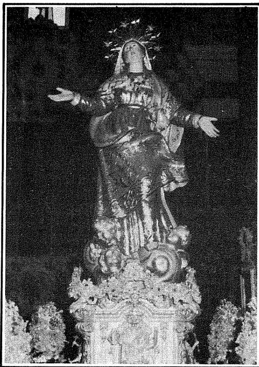
L-Istatwa tal-Madonna meqjuma fil-Parroċċa tal-Gudja.