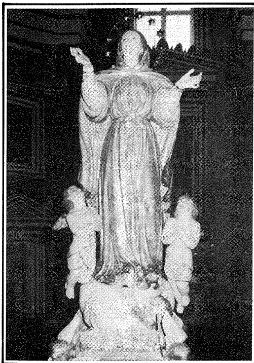
L-Istatwa tal-Madonna meqjuma fil-Parroċċa tal-Mosta.