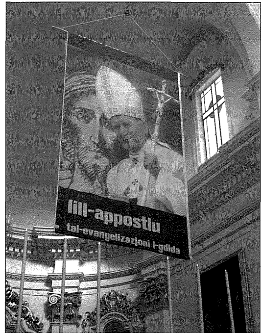
Ir-ritratt kbir li ntrama fuq l-altar maggur tal-knisja parrokkjali bejn is-Sibt 16 u l-Hadd 17 ta' April, 2005

L-ghada, it-Tlieta 19 ta' April, ghall-habta tas-6.00 p.m., il-qniepen taghna inghaqdu f'mota ta' ferh li dwiet mad-dinja kollha ghall-ahbar ferm mistennija tal-hatra tal-Papa Benedittu XVI bhala l-Vigarju ta' Kristu, suċċessur ta' Pietru. Fl-24 ta' April, jum l-insedjament ta' Benedittu XVI fuq it-tron ta' Pietru, gab mieghu ferh kbir espress ukoll b'daq ta' moti ferrieha.