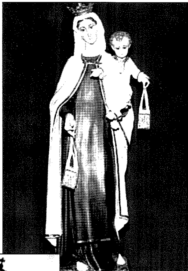
Il-vara tal-Madonna tal-Karmnu

Bidla kbira sehhet fil-gzejjer Maltin fi żmien qasir. Napuljun irnexxielu jeqred it-titli ta' bosta familji nobbli Maltin, iprova jneħhi