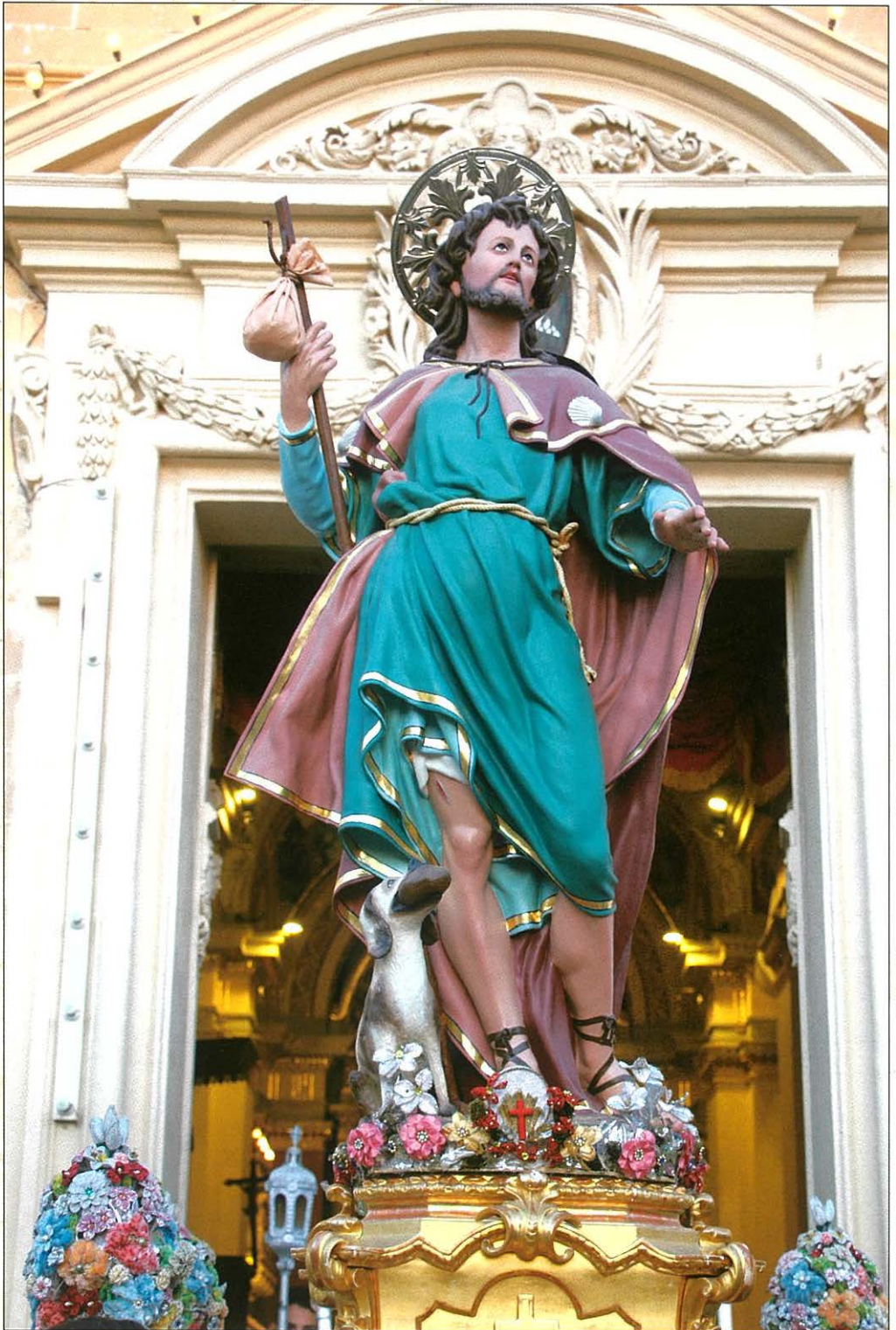
L-istatwa sabiha ta' San Rokku fiż-Żurrieq