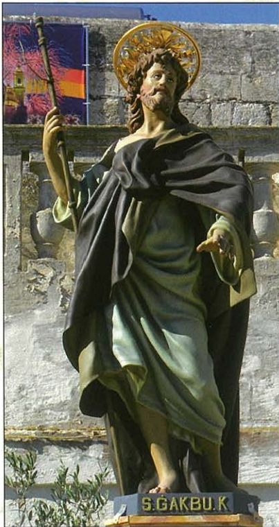
L-istatwa ta' San Ġakbu l-Kbir li tintrama' fin-Nadur li tixbah hafna lil San Rokku taż-Żurrieq