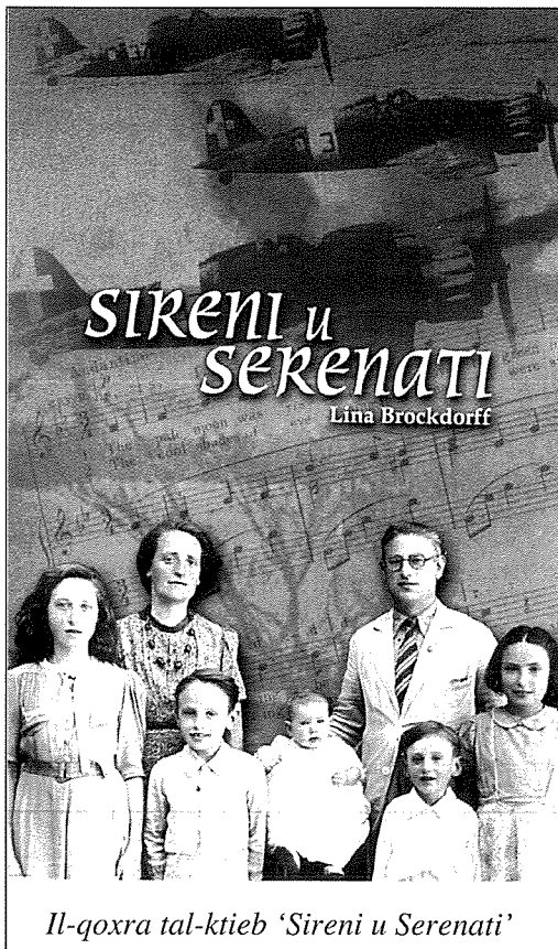
Il-qoxra tal-ktieb 'Sireni u Serenati'