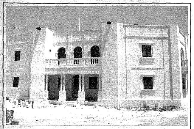
Id-djar il-godda tad-duttrina, waħda għas-subien u l-oħra għall-bniet