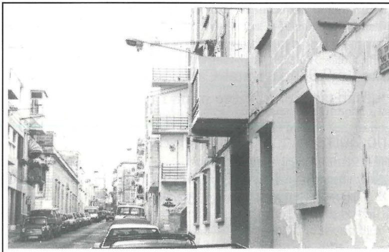
It-Triq Wigi Rosato li hija msemmija għalib.