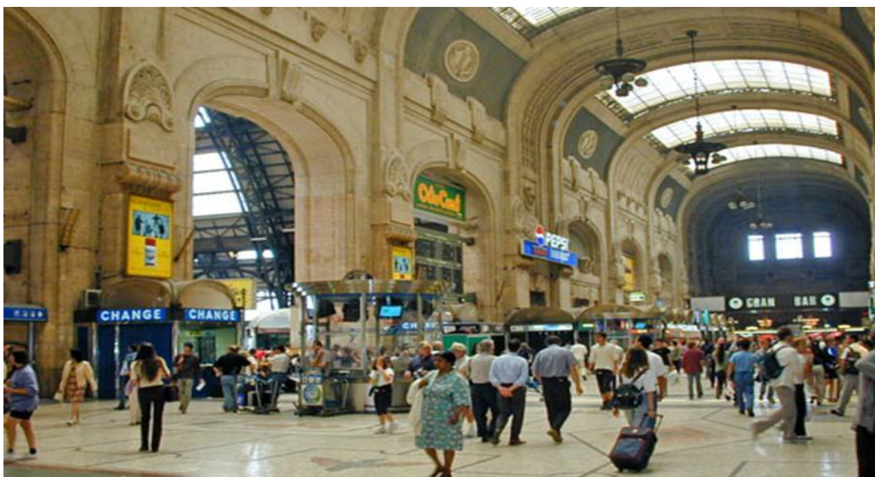
Stazione Centrale di Milano