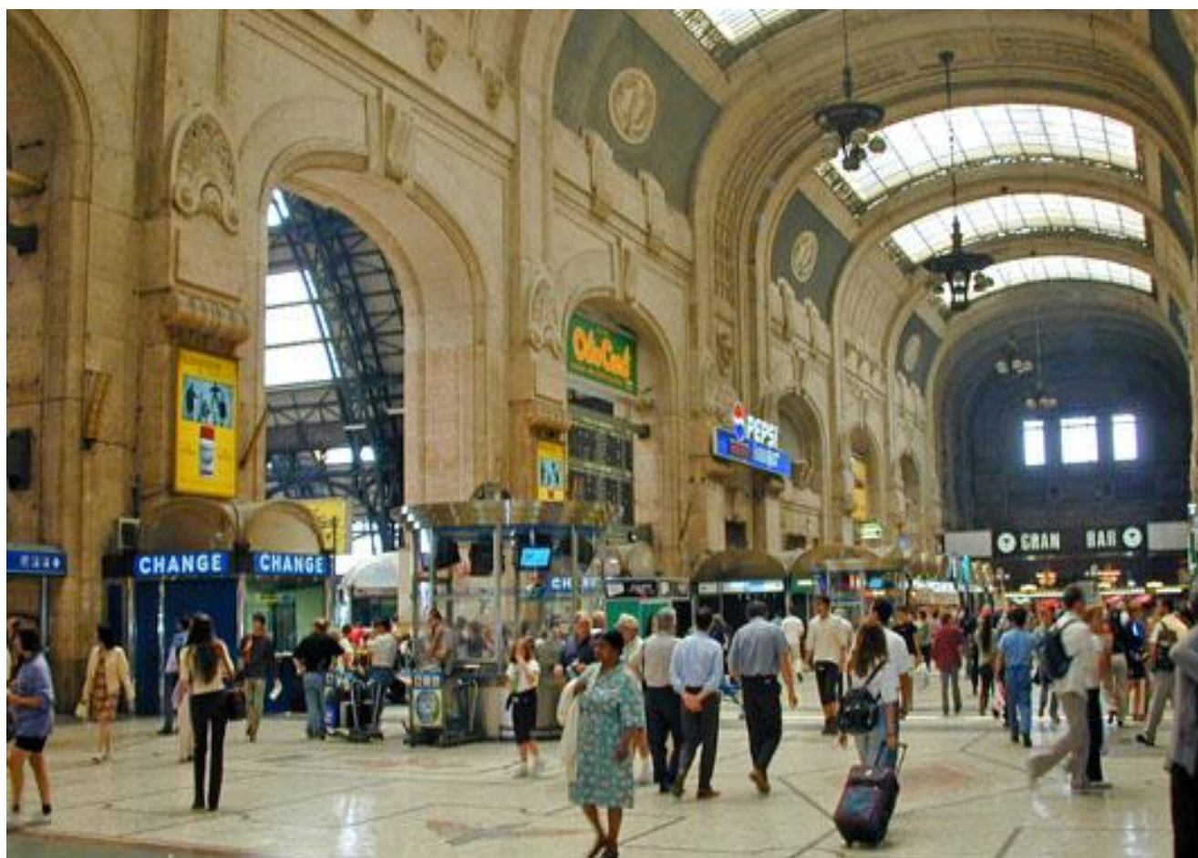
Stazione Centrale di Milano